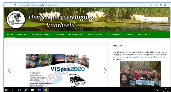
De website van HSV Voorbeeld op desktop

Het spreekt voor zich dat de inhoud van elke verenigingswebsite steeds anders en volledig beheerbaar is.