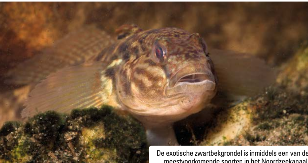
De exotische zwartbekgrondel is inmiddels een van de meestvoorkomende soorten in het Noordzeekanaal.

Uit eerder onderzoek bleek dat gemaal Halfweg een barrière is voor intrekende vis. Rijkswaterstaat en Hoogheemraadschap van Rijnland hebben daarom in 2013 een vispassage aangelegd. In piektijden werden er ruim 200.000 glasaaltjes per dag geteld, waarmee meteen werd bewezen dat de passage werkt. Fred den Dulk is de voormalige pompbaas en woont in het naastgelegen huis. Hij is gefascineerd geraakt voor glasaal sinds de installatie van de vispassage. Samen met twee andere vrijwilligers voerde hij het afgelopen jaar de monitoring uit. "In topweken vingen we met het kruisnet vijftien glasaaltjes per keer", vertelt hij. "Verder vingen we bot en driedoornige stekelbaarzen die duidelijk ook graag naar binnen wilden en massa's langlob-ribkwallen, een nieuwe exoot die zich in het water van het Noordzeekanaal explosief vermeerderd." Bij gemaal Halfweg is een apart vispassage-gemaal geïnstalleerd dat een lokstroom voor trekvis creëert: de vis komt op het zoete water af.