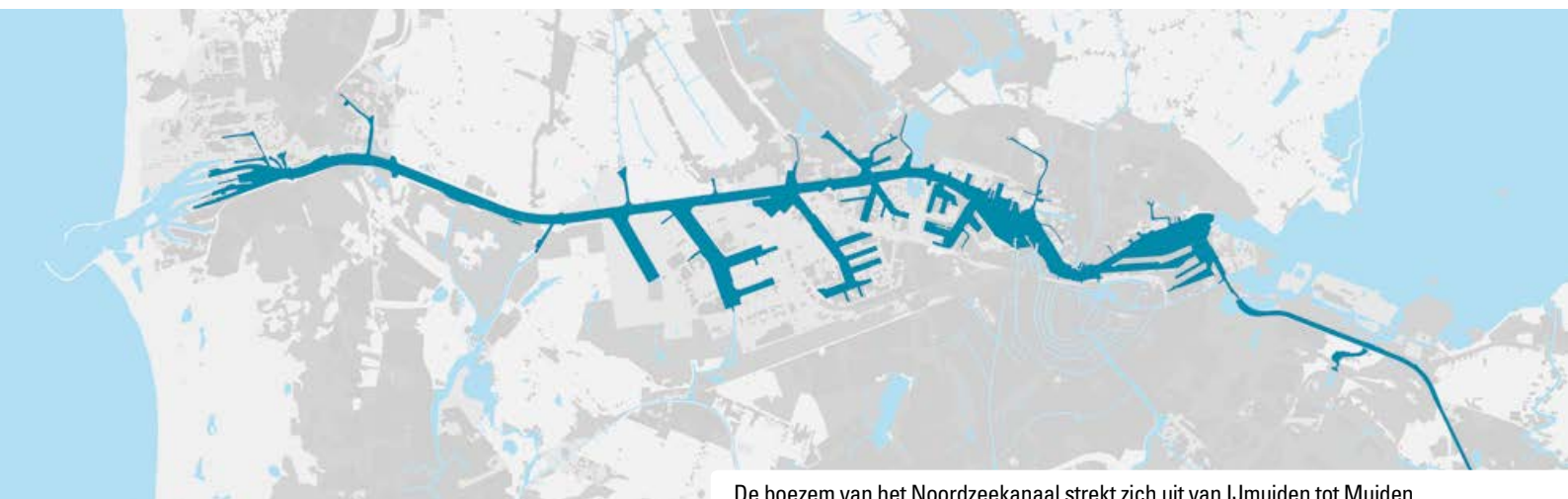
De boezem van het Noordzeekanaal strekt zich uit van IJmuiden tot Muiden.

Het Noordzeekanaal is een van de drukst bevaren scheepvaartkanalen. Het is echter ook een belangrijke migratieroute voor vissen. In 2014 werd met behulp van kruisnetten onderzocht hoe de aanwezige vispassages in dit kanaal functioneren en welke migratiebelemmeringen er nog zijn.