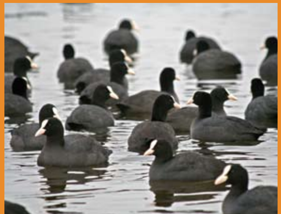
Houd altijd de meerkoeten op je water in de gaten. Zie je ze duiken, dan is de kans groot dat je een goede karpersstek hebt gevonden.