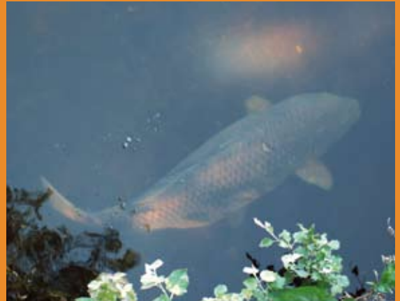
Het restant van het bruisplakaat is nog zichtbaar: alweer een vis die betraapt werd op een niet voor de hand liggende stek, daar wordt binnenkort dus een hengel neergelegd!

Van dichtbij observeren is uiterst leerzaam. Pas je visserij aan de hand van het waargenomen aasgedrag en andere gedragingen aan, en vang meer vis. Hieronder een aantal platen die Hans maakte van onder de kant azende vissen in heldere wateren. Let ook meer poeten die je de weg naar perper kunnen wijzen.