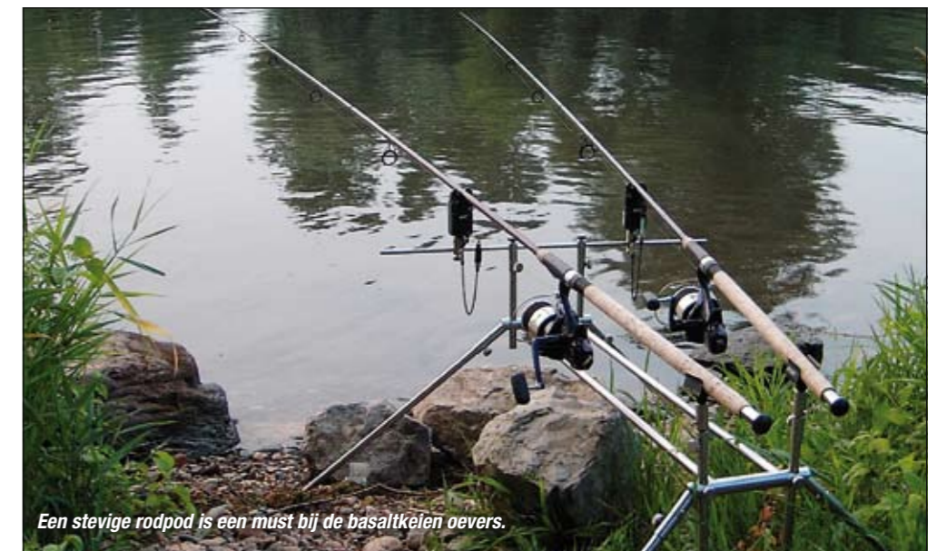
Een stevige rodpod is een must bij de basaltkeien oevers.

In het algemeen kun je stellen dat het grootste probleem op groot water het vinden van de vis is. Heb je daar eenmaal wat inzicht in gekregen, dan zul je merken dat zelfs de vangsten te beïnvloeden zijn. Je vangt grotere aantallen, of minder, maar gemiddeld wat zwaardere, vissen. Uiteraard zijn veel van de in dit artikel geschetste situaties te vertalen naar de meeste andere grote waterpartijen in Nederland. Doe hier je voordeel mee. Onthoud het motto voor karpers op groot water: lokaliseren en houd het simpel. Succes zal dan niet lang uitblijven. Degenen bij wie ik de grootwatervrees weg heb kunnen nemen en enthousiast heb gemaakt voor het vissen op groot water, wens ik daarbij veel succes! ■