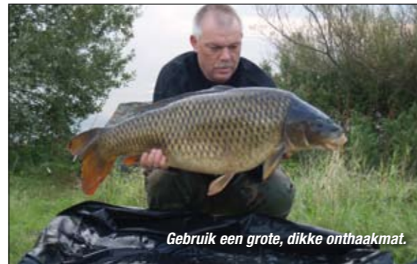
Gebruik een grote, dikke onthaakmat.

Het is voorjaar en het gaat nu echt beginnen: de karper is gearriveerd in de ondiepe zones langs de oevers. Het lokaliseren is nu vrij gemakkelijk. De karpers rollen, springen, wapperen met hun staarten en veroorzaken boeggolven vanuit de kant als je weer eens (per ongeluk en uit enthousiasme natuurlijk) te luidruchtig aan komt stampen. Instant vissend met blikmaïs (nog altijd een aas van formaat) kunnen we nu een behoorlijke potje breken. Het voeren op de makkelijk bereikbare stekken kun je beter achter-