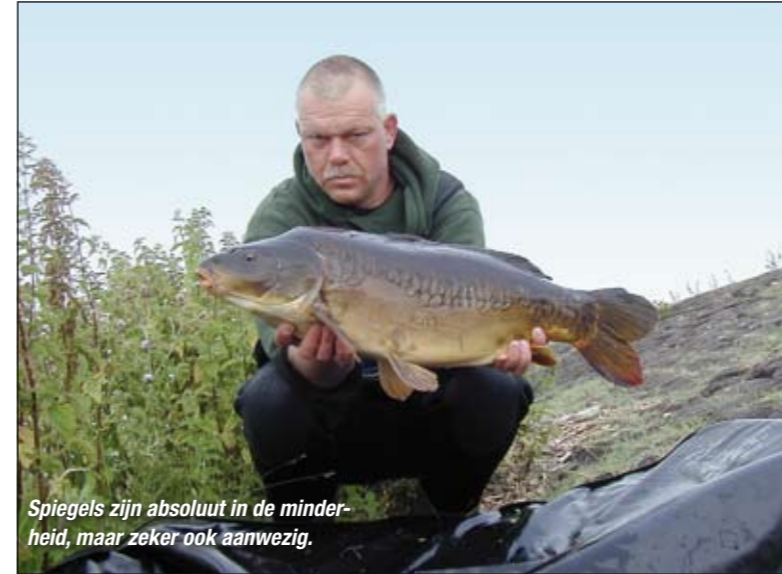
Spiegels zijn absoluut in de minderheid, maar zeker ook aanwezig.

wege laten. De kans is groot dat je voerplek door een onwetende collega-karpervisser wordt afgeroomd. Dit is zonde van je tijd, geld en de mogelijke frustratie. Op de moeilijk bereikbare stekken loont het wél de moeite om met boilies voor te voeren. Zo kun je ook de wat grotere exemplaren op je onthaakmat krijgen.