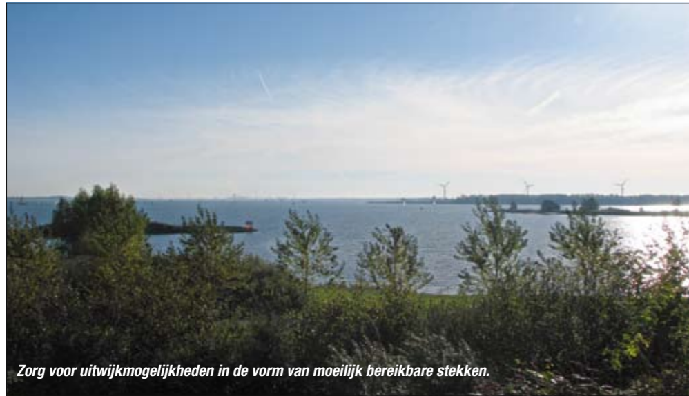
Zorg voor uitwijkmogelijkheden in de vorm van moeilijk bereikbare stekken.

scherpe basaltkei te leiden. De keuze voor een dikkere hoofdlijn, soms tot wel 55/100 aan toe, is een heel bewuste. Een dikke voorslag geknoopt aan een dunner hoofdlijn gebruik ik al een tijdje niet meer. Altijd blijft er op het verkeerde moment van alles achter de verbindingsknoop tussen voorslag en hoofdlijn hangen. Die troep moet je dan eerst weer van je lijn verwijderen, omdat het anders vastloopt in je topoog. Al dat gedoe maakt de kans op het