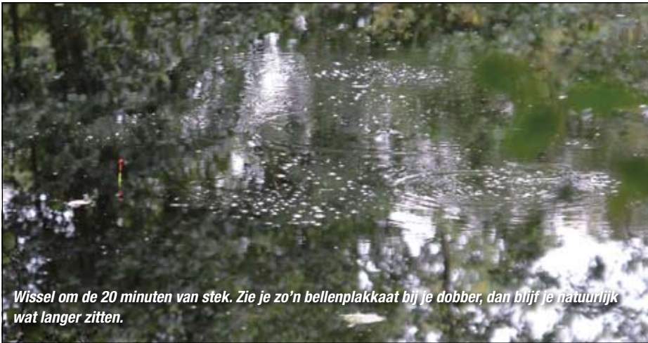
Wissel om de 20 minuten van stek. Zie je zo'n bellenplakkaat bij je dobber, dan blijf je natuurlijk wat langer zitten.

leveren zonder meer karper op. In de hengelsportzaak vind je pellets, maden en wormen. Persoonlijk kies ik vaak voor combi's van deze aassoorten. Waar mogelijk direct op de haak, anders via een haar. Het voer kan bestaan uit allerlei plantaardige zaken. Zelf maak ik een mix van twee delen fazantenvoer (de variant met gebroken maïs) en een deel hennep dat ongeweekt wordt gekookt (weken doet het tijdens het koken, dus ruim twee keer zoveel water als partikels gebruiken). Dit mengsel laat ik afkoelen in het kookwater. Voeg net zoveel water toe totdat alle partikels verzadigd zijn en nog onder water staan. Liefst, en nou komt het, een week of wat van te voren, zodat het goed