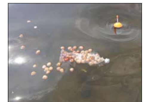
12.15 uur: De PVA lost al snel op en laat de brokken en een wolk amino-aid vrij. Het duurt een paar minuten voordat de eerste karpers lucht krijgen van deze lekkernij. Toch blijven de vissen alert en eten niet alle brokken op.

Wanneer je op dit soort grote afstanden aan de oppervlakte vist, zul je toch ook graag nog wat voer in de buurt van je haakaas willen krijgen. Hier zijn verschillende manieren voor. Sommige mensen zweren nog altijd bij het gebruik van