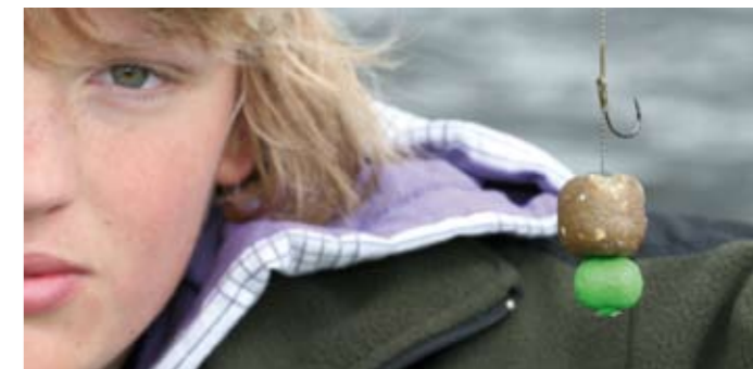
...werd vervangen door een 'snowman': een pop-up boven een zinkende boilie.

Bekende Vinkeveeners? RTL Boulevard zou je zo een opsomming kunnen geven. André Hazes en Johan Cruyff bijvoorbeeld hadden er ooit hun ideale woonstek gevonden. In karpereaters doelt men bij 'bekende Vinkeveeners' op zware vissers zoals Stip, de Lompe en Houdini. Karpers die één of meerdere keren zijn teruggevangen, 40-ponders of hoge 30-ponders. De Lompe laat zich relatief vaak vangen, terwijl Houdini zich als de vermaarde boeienkoning van weleer van (bijna!) elke onderlijn weet te ontdoen.