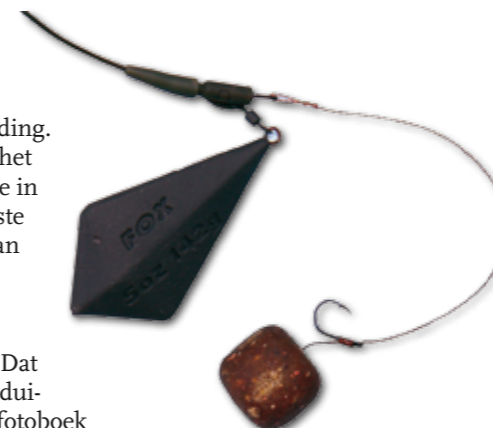
De standaard rig, waarmee de eerste twee vissen gevangen werden...

weinig voorbereiding. Ja, waarom naar het zuiden gaan als je in een van de mooiste sportvislandden van de wereld woont, terwijl hier nota bene ook 'beren' rondzwemmen? Dat laatste blijkt overduidelijk als we het fotoboek hebben bekeken. Dit voorjaar alleen landden er al tien dertigers op de mat van de kajuitboten, méér dan andere jaren. Het 'voerbootje' – van zes meter lengte – wordt na het uitvaren van de lijnen tussen de twee kajuitboten gelegd. Zo kunnen we bij een aanbeet in de Jon-boot springen om de