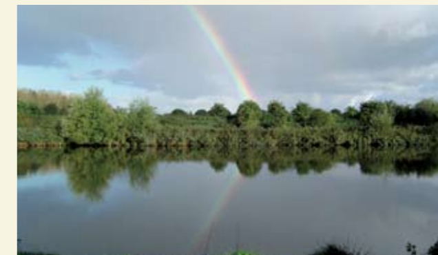
Veel geweldig, karperrijk viswater!

Flevoland is gezegend met een enorme hoeveelheid uitstekend viswater. Je vindt hier diverse schitterende plassen, vele eindeloze weteningen, en niet te vergeten twee schitterende vaarten. De Hoge Vaart loopt door het zuidelijke en oostelijke gedeelte van Flevoland en we hebben de Lage Vaart, die meer door het westelijke en noordelijke gedeelte loopt.