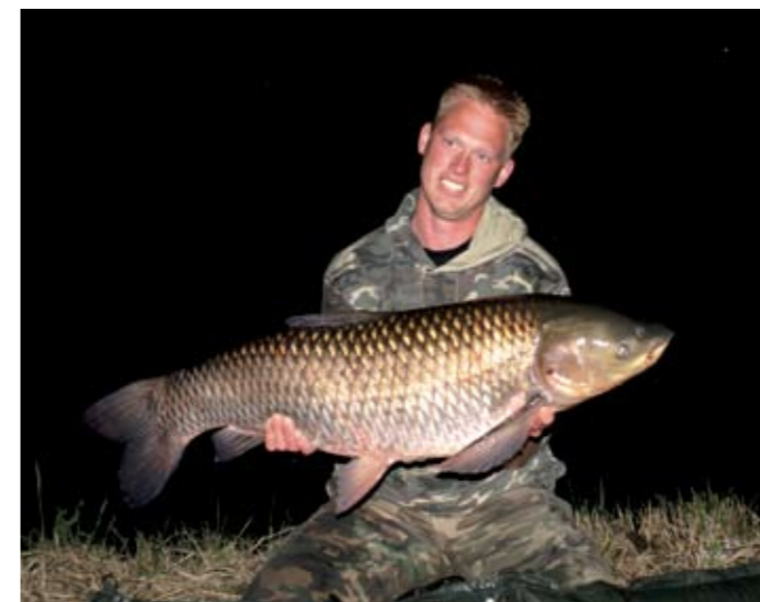
Een machtige graskarper die even kwam bunkeren op een voerbed van maïs.

Zoals gezegd kun je zonder voorbereidingen gelijk karper oogsten, maar een voercampagne van meerdere dagen is ook een interessante optie. Ik ken hier een paar jongens die minimaal 6 á 7 dagen achter elkaar voorvoeren met maïs, en dan vervolgens in één nacht tientallen polderschubs weten te vangen. Ik heb er eens een uurtje bijgestaan, en wist niet wat ik zag.