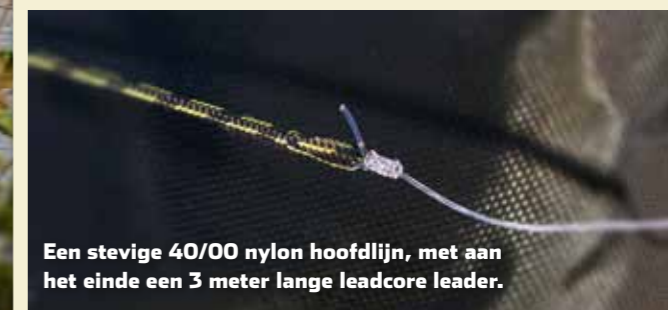
Een stevige 40/00 nylon hoofdlijn, met aan het einde een 3 meter lange leadcore leader.

Kanaalvissen is geen kattenpis - en het immense Amsterdam-Rijnkanaal al helemaal niet. Ruige elementen zoals mosselbanken en scherpe damwanden vragen om robuust materiaal. Een kijkje in de uitrusting van Michiel.