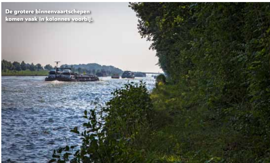
De grotere binnenvaartschepen komen vaak in kolonnes voorbij.