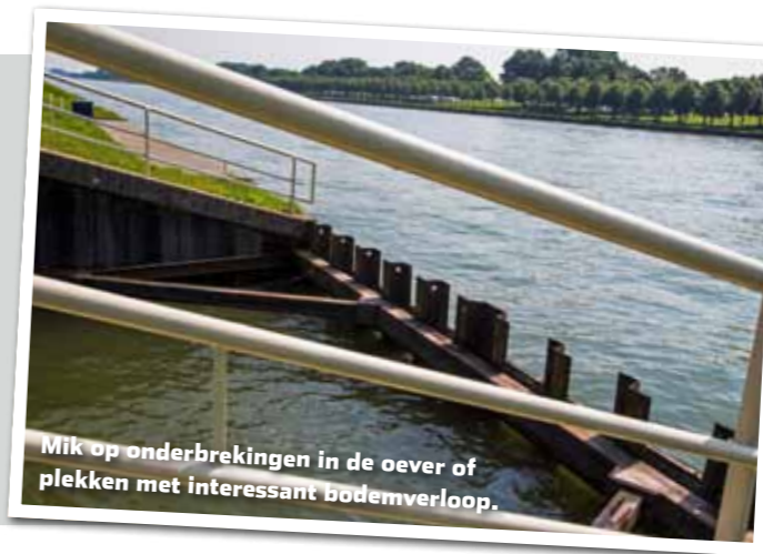
Mik op onderbrekingen in de oever of plekken met interessant bodemverloop.

Wanneer je kiest om voor te voeren, kies dan een stek die van nature karper aantrekt. Denk dan aan bruggen, sluisjes, onderbrekingen in de oever, havens, lozingen, en interessante stukken bodem zoals een kuil of geultje. Voer van strak tegen de kant tot in de vaargeul. Zo bereik je ook karper die verderop langs zwemt en houd je die daardoor wellicht langer vast op het stuk kanaal waar je vist.