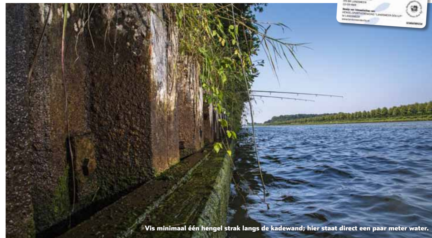
Vis minimaal één hengel strak langs de kadewand; hier staat direct een paar meter water.