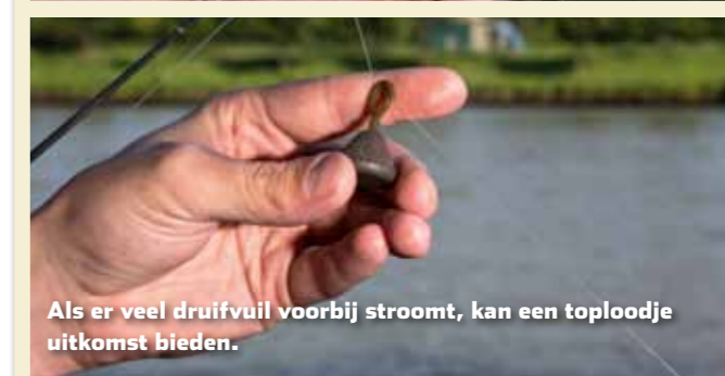
Als er veel drijfvuil voorbij stroomt, kan een toploodje uitkomst bieden.