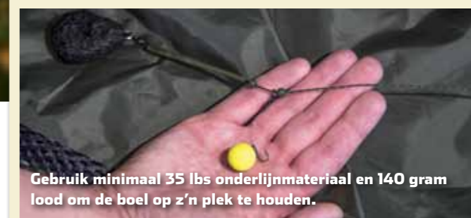
Gebruik minimaal 35 lbs onderlijnmateriaal en 140 gram lood om de boel op z'n plek te houden.