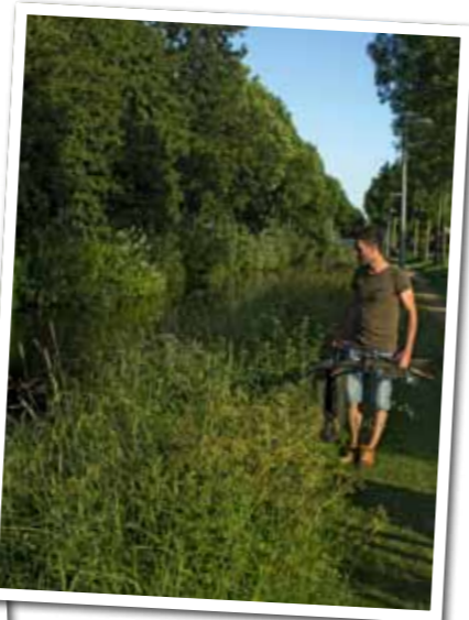
Door de mobiele uitrusting maak je makkelijk 'meters' en struin je in rap tempo hele watergangen af op zoek naar dikke ruggen en schimmen.

spannendste, eenvoudigste en goedkoopste manieren van het karpervissen. Een visserij