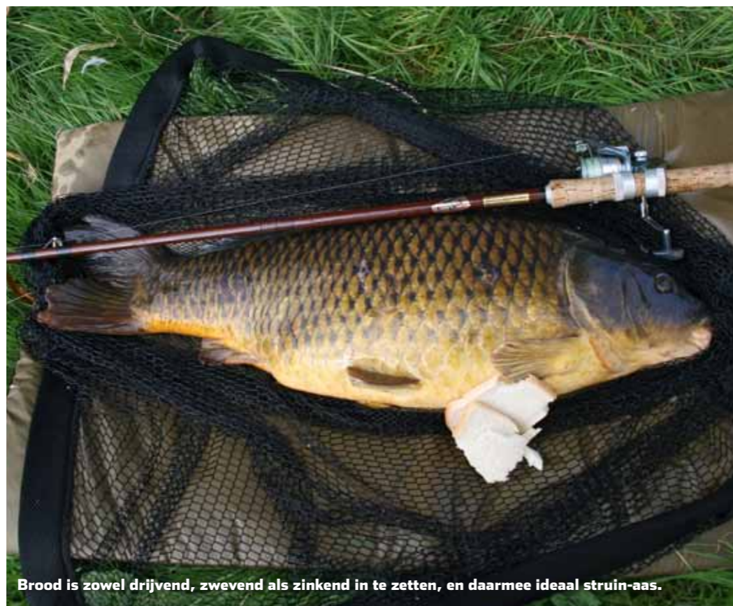
Brood is zowel drijvend, zwevend als zinkend in te zetten, en daarmee ideaal struin-aas.

werpen. Soms is een beetje geduld bittere noodzaak, bijvoorbeeld als de vis nog te ver weg zwemt of nog te