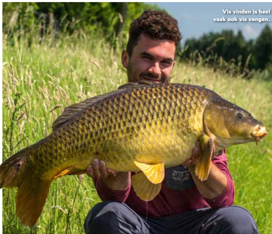
Vis vinden is heel vaak ook vis vangen.

De kracht van de eenvoud is mijn uitgangspunt. Waarom moeilijk doen als het ook makkelijk kan? Een karper verleiden is in feite niets meer of minder dan zorgen dat je aas nabij de vis wordt aangeboden – en vervolgens maar hopen dat de smikkelaar het aasje pakt. Simpelheid troef dus. Enkel een haak op de hoofdlijn en puur op zicht 'jagen'. Wees daarbij te allen tijde voorzichtig als je vis benadert. Vermijd 'oogcontact' met de vis en stel je als een ware bosjesjager op. Probeer geen snelle of onverwachte bewegingen te maken, ook niet met je hengel. Als je inwerpt, gooi dan niet bovenop de vis maar in de zwemrichting of een paar me-