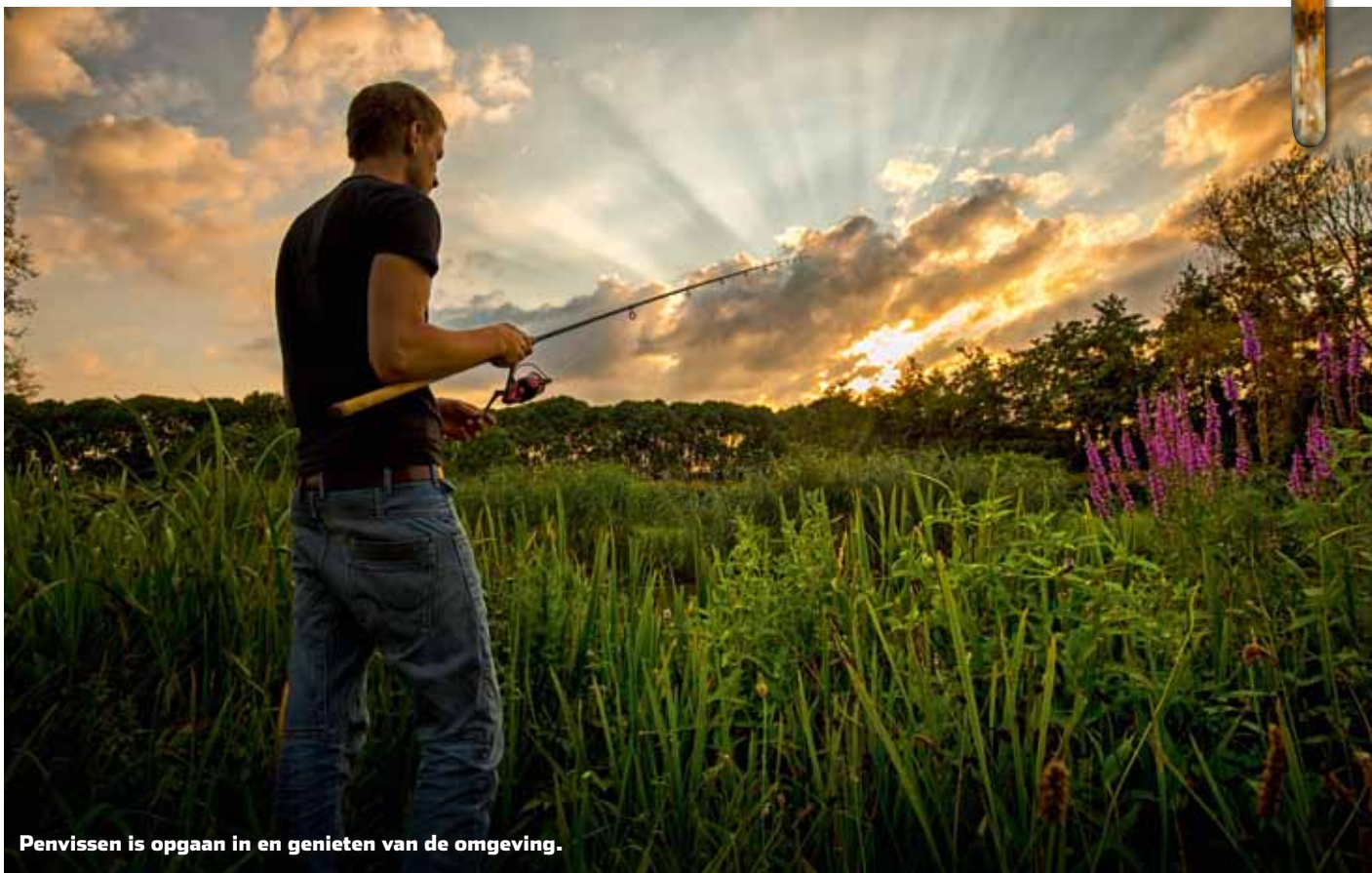
Penvissen is opgaan in en genieten van de omgeving.