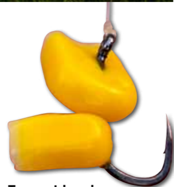
Twee maiskorrels op de haak zijn standaard.

Aan de hand van de activiteit op de stekken bij het voeren, bepaal ik op welke stek ik als eerste ga vissen. Doorgaans