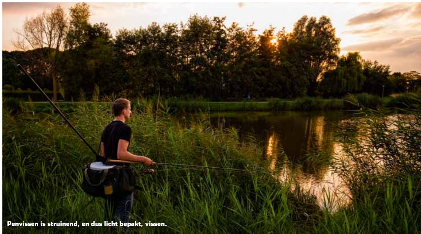
Penvissen is struinend, en dus licht bepakt, vissen.

S truinend vissen is actief vissen. Dat geldt ook voor de visserij op graskarper. Zorg dus dat je mobiel bent en licht bepakt aan de waterkant verschijnt. Het eerste wat ik doe als ik daar aankom, is het water goed observeren – zeker als het een voor mij nieuw water betreft. Een polaroidbril is daarbij haast onontbeerlijk. Waar is de windkant? Zijn er drijfvuilhoekjes? Bewegen er op een plek veel waterplanten? Zie ik wellicht al ergens in het wateroppervlak donkere