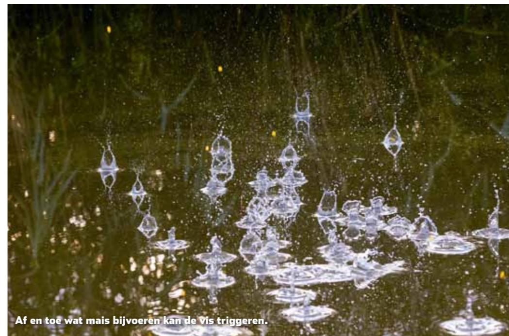
Af en toe wat mais bijvoeren kan de vis triggeren.

De montage is verder simpel. Eerst schuif je een stuitje (van rubber, nylon of touw) op de lijn, daarna de pen en vervolgens de loodhagels. Qua pen heeft een hardhouten exemplaar met een metalen oogje aan de onderkant mijn voorkeur. Deze schuiven goed over de lijn en blijven niet halverwege 'steken', zoals bij een plastic pen nog wel eens het geval is. In de meeste stadswateren kun je met een pen van 0,8 - 1 gram meestal prima uit de voeten. Lood deze iets te zwaar uit, zodat je pen zinkt op het onderste loodhageltje (dat op 5 tot 10 centimeter van