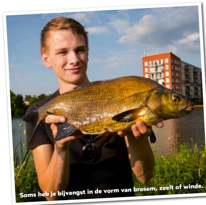
Soms heb je bijvangst in de vorm van brasem, zeelt of winde.

Als haakaas kies ik vrijwel altijd voor twee maiskorrels. Deze prik ik op de haak en haal ik door totdat de kor-