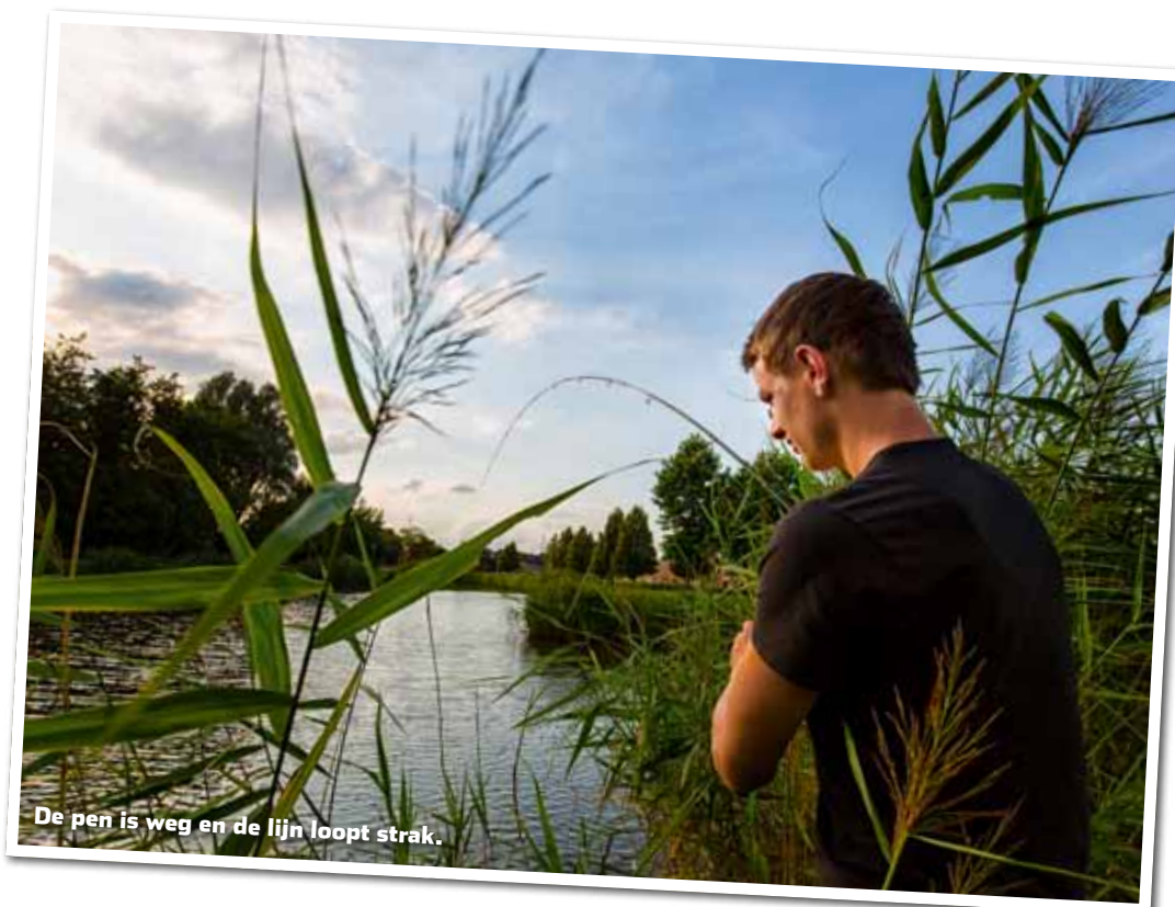
De pen is weg en de lijn loopt strak.

je haak zit). Schuif het stuitje daarna omhoog totdat alleen het puntje van de pen boven water uitsteekt. Het onderste loodhageltje ligt nu op de bodem, zodat je altijd scherp zit te vissen.