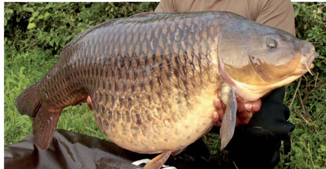
Hoewel de Maasvisserij niet gemakkelijk is, maakt het formaat van de vissen deze zeker de moeite waard.