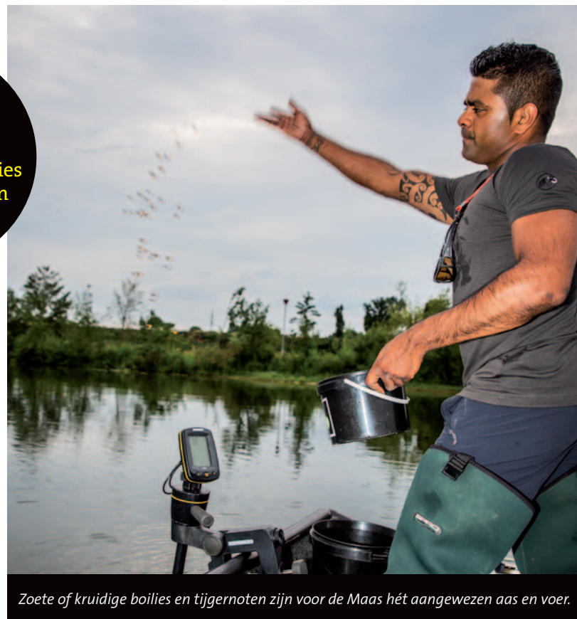
Zoete of kruidige boilies en tiggernoten zijn voor de Maas hét aangewezen aas en voer.

De stek waar Charith begint te vissen, ligt aan de rivier. Daar bevist hij met een hengel de rand van de vaargeul, op vijf meter diepte. Met de andere hengel vist hij dicht bij de oever op drie meter water. Per hengel gaan er twee scheppen boilies en tiggernoten bij om de vis erop te attenderen dat hier wat te halen valt. De montages zijn eenvoudig doch solide. Naar gelang de sterkte van de stroming een flink werpgewicht – 100 tot 200 gram of zwaarder – een soepele en stevige 40lb onderlijn en een stevige 'wide