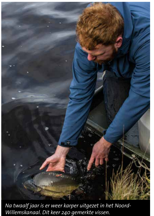
Na twaalf jaar is er weer karper uitgezet in het Noord-Willemskanaal. Dit keer 240 gemerkte vissen.