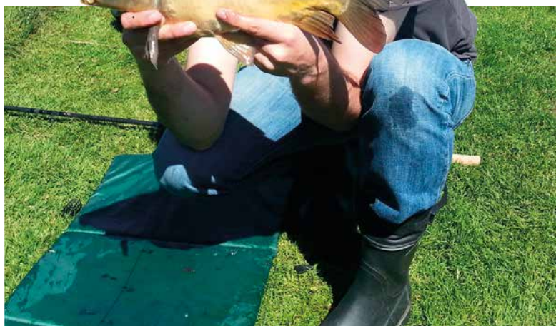
Eén van de door sportvissers teruggemelde vissen.

De teruglopende (spiegel)karpervangsten op de grote kanalen in Groningen en Drenthe, waren voor De KSN regio Groningen-Drenthe aanleiding om aan de slag te gaan met de voorbereidingen van het uitzetten van spiegelkarpers. Er werd een uitgebreid plan neergelegd bij Hengelsportfederatie Groningen Drenthe, die dit met de waterschappen besprak. In waterschapskringen werd dit plan niet juichend ontvangen: waterschappen investeren veel in het herstellen van natuur in beken en meren, die vaak in verbinding staan met de grote kanalen. De vrees was dat de uitgezette karpers massaal de kwetsbare beken zouden optrekken, wat een negatief effect op het natuurherstel zou hebben. De federatie deelt deze zorg niet, maar om duidelijkheid te krijgen werd besloten een proef te doen met het uitzetten van gemerkte karpers. Sportvisserij Nederland onderzoekt daarom het trekgedrag van de 240 karpers.