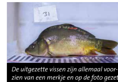
De uitgezette vissen zijn allemaal voorzien van een merkje en op de foto gezet.

En dan waar het onderzoek om draait: de gegevens over het trekgedrag. De 36 karpers met een zendertje zijn verdeeld in twee groepen: 18 vissen zijn uitgezet tussen Yde-De Punt en Groningen en 18