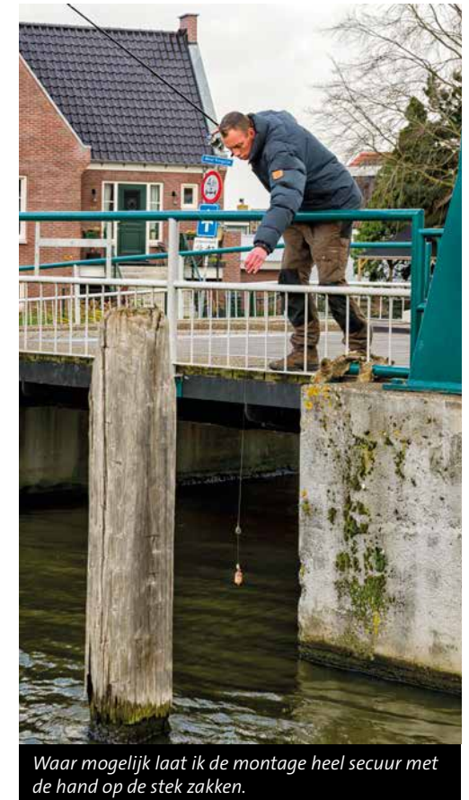
Waar mogelijk laat ik de montage heel secuur met de hand op de stek zakken.

Hoe kouder het water, hoe passiever de karper. Als de vis 'vast' ligt, kan een paar meter te ver weg vissen al een blank opleveren. Kies dus voor een compact voerplekje van hooguit één vierkante meter – karper is prima in staat om kleine, specifieke voerplekjes te onthouden. Kam vooraf altijd eerst de bodem uit met een shadje of ander kunst-aas: je wilt je rig niet bovenop een tak, kabel, fiets of winkelwagen deponeren. Een harde bodem – waarin je aas minder snel wegzakt – geniet daarbij de voorkeur, maar blijf wel dicht bij het betonnen brugfundament. Aangezien het nauw luistert waar je precies gaat vissen, geniet het zelf uitlopen en laten zakken van je montage – of het gebruik van een radiografisch voerbootje – de voorkeur boven een iets minder nauwkeurige worp.