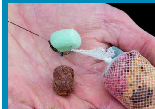
PVA-zakje met boilies, klein aas en een PVA-foampje.

In de winter zweer ik bij PVA-zakjes die ik vul met wat gebroken en verkrumelde boilies. Aangezien ik korte sessies van 2 tot 2,5 uur vis, wil ik de vis snel en exact naar mijn aas leiden. Daarom voer ik ook hooguit één handje gebroken boilies bij. Anders heeft de karper in die twee uur niet voldoende tijd om alles weg te vreten en bij mijn rig te eindigen. Kies voor een PVA 'funnelweb' met een zo fijn mogelijke 'mesh' – bijvoorbeeld de '4 season funnelweb' van Korda. Bij lage watertemperaturen duurt het immers langer voordat PVA oplost. Prik de haakpunt slechts dunnetjes door de kous heen, zodat je haak onder water snel vrij komt te liggen. Daarbij prik ik ook altijd een PVA-foampje op de haak, zodat de punt daarvan schoon blijft. Komt dit foampje boven drijven, dan voer ik vanaf de brug heel secuur nog een handje gebroken boilies bij. Doe dit zo dat er geen voer op of naast de lijn of montage komt. Voer juist 'achter' je aas – oftewel in het verlengde van je onderlijn – zodat de vis niet schrikt van je lijn.