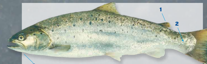
Zeeforel Salmo trutta trutta Lengte tot ca. 140 cm

Herkenning 1 Heeft een vetvin. 2 Tussen de achterkant van de vetvin en de zijlijn liggen, geteld in de richting van de aangegeven pijl, 14-17 rijen schubben. 3 De bovenkaak loopt door tot achter het oog. Op het lichaam komen zwarte, min of meer kruisvormige vlekjes voor. De zeeforel is de trekkende vorm van de forel. Kan worden verward met de zalm.