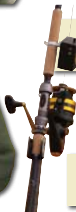
Halibut Crab pellets en popups.