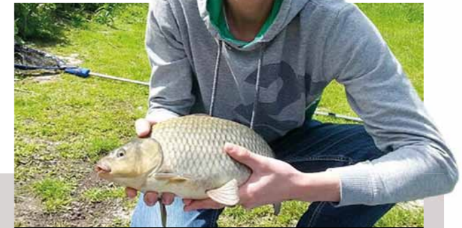
Zo vader, zo zoon. En na 20 jaar alsnog die eerste karpers!

Zaterdag 30 mei – nota bene Nationale Hengeldag –