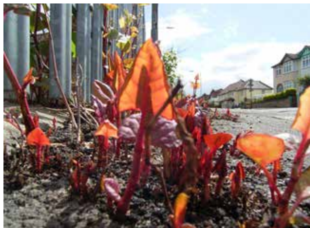
Japanse duizendknoop groeiend door asfalt.

Voor nadere informatie over de verspreiding van exoten, kaarten, foto's, samenvattingen en wetenschappelijke publicaties zie: http://www.cabi.org/isc Verdere informatie over het werk aan biologische bestrijding van Japanse duizendknoop in het Verenigd Koninkrijk kan gevonden worden op: http://www.cabi.org/japaneseknotweedalliance/ .