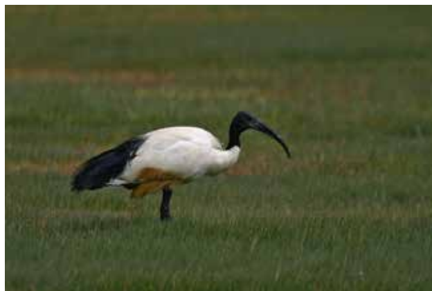
Heilige ibis.

De aantallen broedende heilige ibissen worden gevolgd binnen het Meetnet Broedvogels in het kader van het NEM gecoördineerd door Sovon Vogelonderzoek Nederland (zie www.sovon.nl ). Losse waarnemingen van niet broedende vogels kunnen worden doorgegeven via telmee.nl of waarneming.nl .