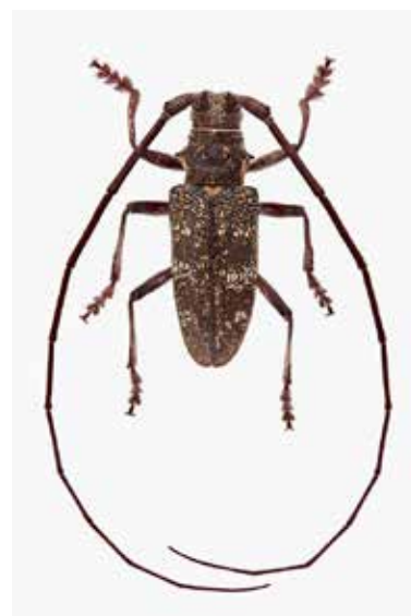
Sparrenboktor ( M. sutor ), noordelijke geelschildboktor ( M. urussovii ) en dennen-geelschildboktor ( M. galloprovincialis ).