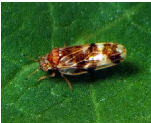
Volwassen Aphalara , lengte 2 mm.

Biologische bestrijding wordt al meer dan een eeuw toegepast om invasieve onkruiden aan te pakken in de landbouw en natuur. Wereldwijd zijn al meer dan 1300 biologische bestrijders ingezet om 400 invasieve onkruiden aan te pakken. In Noord-Amerika, Australië en Zuid-Afrika is de methode veelvuldig toegepast en blijkt het op de lange termijn vaak de enige effectieve en ecologische oplossing. Hoewel Europa tot nu toe de "donor" is van 152 biologische bestrijders van onkruiden elders, is het introduceren van biologische bestrijders in Europa nog steeds een nieuw concept.