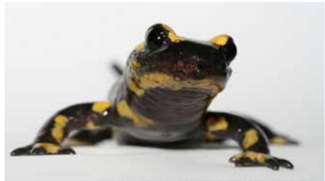
Vuursalamander ( Salamandra atra ) geïnfecteerd door de salamanderetende schimmel, de huid is ernstig aangetast.

An Martel: "Als een ziekte lange tijd aanwezig is in een gebied, ontwikkelen dieren resistentie. Globalisering heeft ertoe geleid dat mensen en dieren zich over de hele wereld verplaatsen, waardoor ziekteverwekkers in contact komen met gastheren die niet de kans hebben gehad om resistentie op te bouwen. Hierdoor kunnen ziekteverwekkers die in een nieuwe omgeving komen, zoals Bs, in erg korte tijd veel soorten met uitsterven bedreigen".