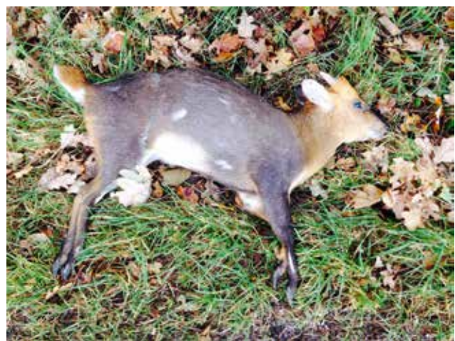
Verkeersslachtoffer muntjak Landgoed Baest.

Naar verwachting treedt op 1 januari 2015 de Positieflijst in werking, waarmee het houden van exotische zoogdieren voor een belangrijk deel wordt ingeperkt. De lijst is nog niet definitief; de muntjak zal er niet op komen vanwege het bezits- en handelsverbod. Het sikahert zal er naar verwachting wel opkomen, als te houden diersoort onder voorwaarden.