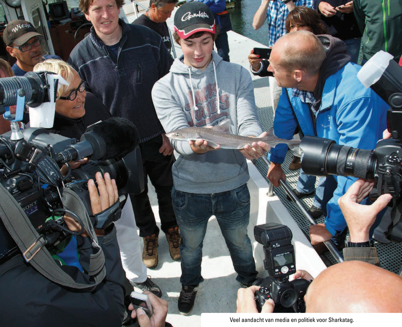
Veel aandacht van media en politiek voor Sharktag.

het Verenigd Koninkrijk) behoren tot de top 20 landen die verantwoordelijk zijn voor 80% van de haaienvangsten.