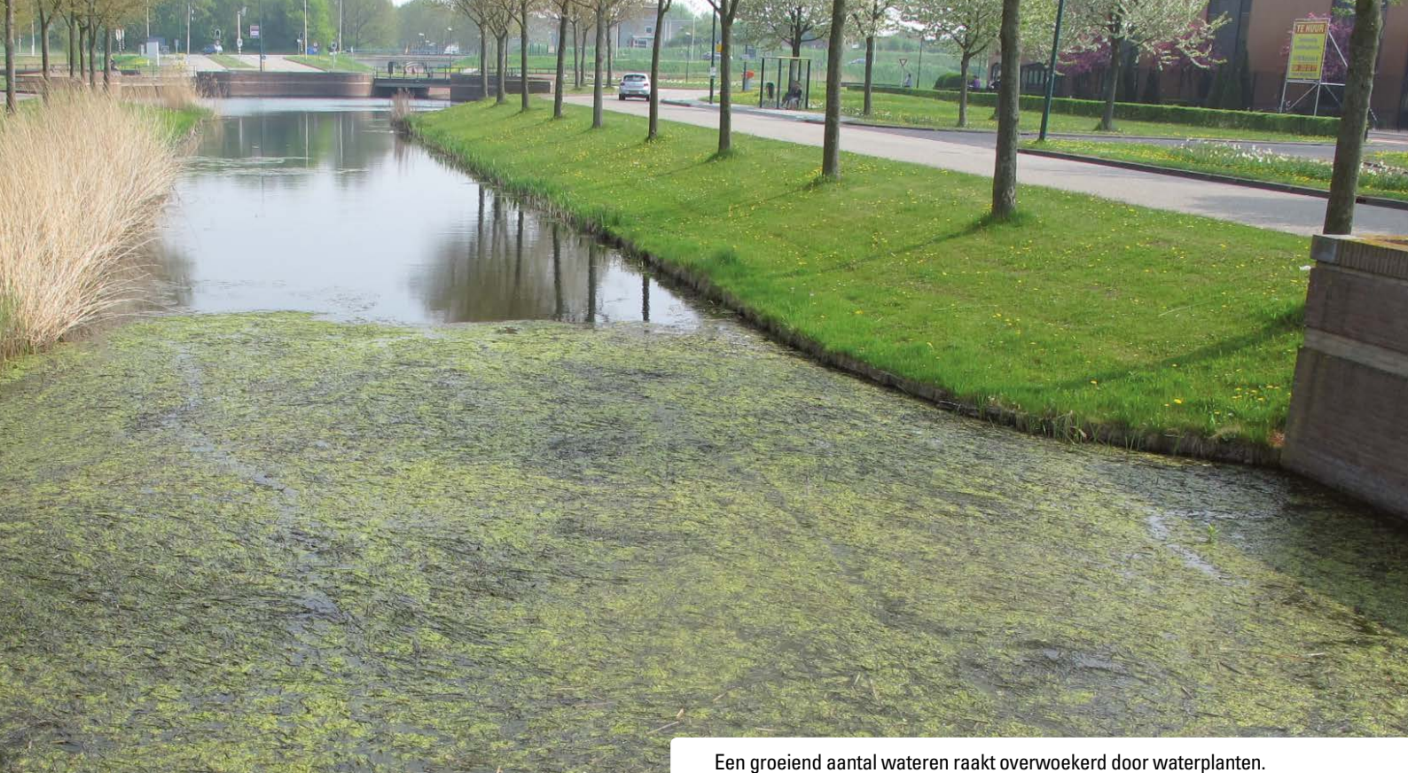
Een groeiend aantal wateren raakt overwoekerd door waterplanten.