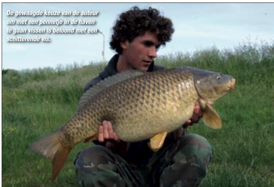
De gewaagde keuze van de auteur om met een pennetje in de haven te gaan vissen is beloond met een schitterende vis.

Riviervissen hebben doorgaans nog maar weinig onhaakmatten gezien en zijn dus niet al te moeilijk te vangen – als je ze eenmaal hebt gevonden. Daarom houd ik mijn montage erg eenvoudig. Ik gebruik een zogenaamde Engelse pen die je alleen met de onderzijde tussen twee rubber stoppers op de nylon hoofdlijn zet. De reden dat ik rubberen stoppers gebruik is dat deze makkelijk over de lijn schuiven als de pen ergens achter blijft hangen tijdens de dril. Ik 'overlood' het geheel met twee vrij grote loodjes: de pen moet zinken op het tweede loodje. De dobber zal dus zinken als je hiermee niet op de bodem ligt. Dan knoop je er nog een weerhaakloos haakje maat 6 of 8 aan en klaar ben je. Hierbij verkies ik absoluut om de weerhaak van een standaard karperhaak plat te knippen zodat er een klein bobbeltje ontstaat. Dit houdt de haak mooi op z'n plek tijdens de dril, veel beter dan een volledig weerhaakloos exemplaar. Over het aas kan ik het heel kort zijn. Simpele blikmaïs of een gekookte aardap-