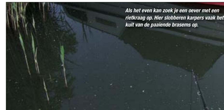
Als het even kan zoek je een oever met een rietkraag op. Hier slobberen karpers vaak het kuit van de paaiende brasems op.

Het penvissen in havens is een hele speciale en verslavende visserij die vooral in april en mei erg goed kan zijn. De kick van het vangen van prachtige rivierkarpers is werkelijk onbeschrijfelijk. Je kunt er alle vormen, maten en soorten karpers verwachten. Een krakende hengel in je hand, volop gierende slip, het hart klopt in je keel en de adrenaline giert door je aderen. Geef daarom niet zomaar op! Bij de havenvisserij horen zo nu en dan ook tegenslagen in de vorm van visloze dagen, vijftig brasems op een middag of een wapperend lijntje na enkele minuten drillen. It's all in the game, dus op naar de waterkant! ■