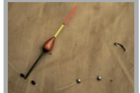
De dobber zet je vast op de lijn tussen twee rubber stopperjes. Deze kunnen mooi verschuiven, mocht de lijn langs een steigerpaal schuren.