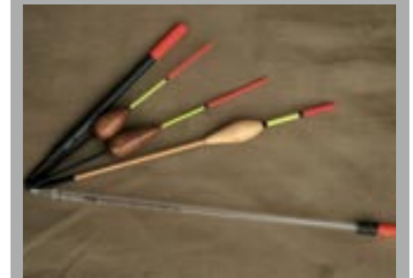
Ondanks dat je het op grote en wilde vissen gemunt hebt, gebruik je toch erg lichte pennetjes. Met deze modellen zit je altijd goed.

Hoe simpel Pascals aanpak ook is, hij let wel degelijk op de details die zijn montage tot een betrouwbaar geheel maken.