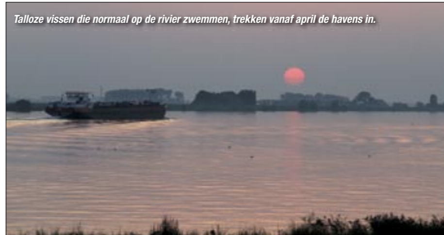
Tallose vissen die normaal op de rivier zwemmen, trekken vanaf april de havens in.

pel direct op de haak vist fijn en haakt prettig. Maak het jezelf niet te moeilijk op dat gebied. Als je erg veel last hebt van witvis kun je de zoete, zachte blikmaïs vervuilen voor kippenmaïs. Deze week twee dagen, kook je een uur op een laag pitje en laat je nog enkele dagen in de week staan. Je kunt de maïs dan mooi op je haak krijgen en witvis houdt zich net even wat rustiger. Voor je gaat vissen maak je een stuk of vier voerplekjes waar je enkele handjes maïs neergooit. Deze stekken vis je achtereenvolgens af.