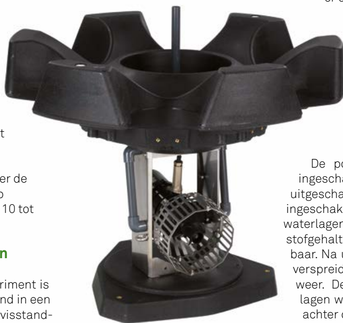
De drijvende pomp is eenvoudig te plaatsen.

De pomp werd om 04:00 uur ingeschakeld en om 10:00 uur uitgeschakeld. Zodra de pomp werd ingeschakeld was de menging van de waterlagen aan de hand van de zuurstofgehalten duidelijk waarneembaar. Na uitschakeling van de pomp verspreidde de waterlagen zich weer. De menging van de waterlagen was gemiddeld tot 20 meter achter de pomp meetbaar. ➤