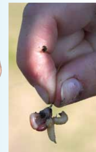
Maden en wormen - of een cocktail daarvan - zijn regelrechte topaasjes.

garriveerde Engelsman ook al snel enkele karpers weet te landen, krijgt een derde hengelaar een alsmaar langere nek van het kijken naar de vissen van zijn burens. Dit bewijst eens te meer dat vangen ook in karpervijvers niet vanzelf gaat.