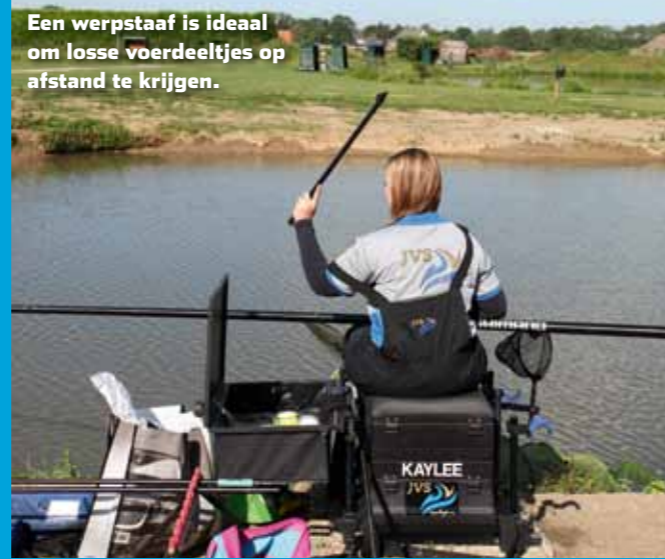
Een werpstaf is ideaal om losse voerdeeltjes op afstand te krijgen.

Voer in karpersputten niet zozeer heel veel ineens, maar liever frequent kleine hoeveelheden. Gooi, cup of werp met een werppijp om de tien minuten wat lokvoer op de voerplekjes die je hebt aangelegd - ook als je er even niet vist. Het voortdurend bijhouden van een voerplek is namelijk van doorslaggevend belang. Zo blijft deze attractief en het geluid van in het water vallend voer trekt karpers aan.