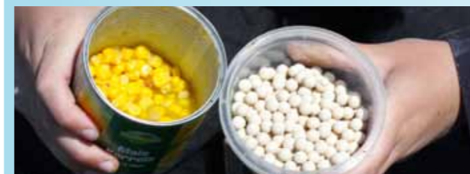
Zachte maïs uit blik en miniboilies zijn top.

Anders dan bij het vissen op witvis, doe je er op karpervijvers goed aan om met grove voedseldeeltjes te voeren en vissen. Laat je grondvoer dus gerust thuis. Hier Kaylee's karpers top 5. Maar neem gerust ook eens witbrood (voor een pluim of vlok) of gekiemde hennep mee.