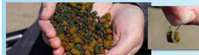
Kleine vismeelpellets, hard en zacht - hebben een sterke uitwaseming en vangen super. Harde pellets monteer je via een baitband (zie inzet), zachte pellets (softies) direct op de haak.