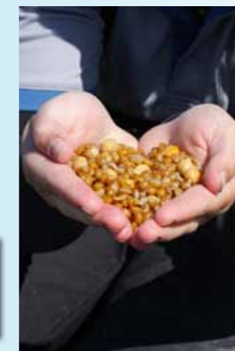
Geweekte tarwe: een nog relatief onontdekt karpers, maar daarom niet minder effectief!