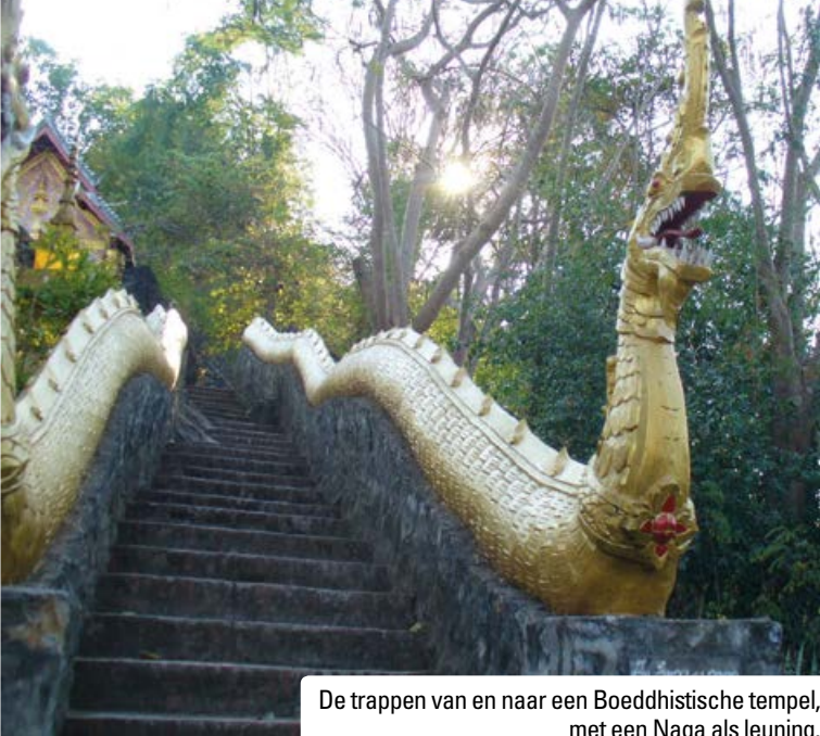
De trappen van en naar een Boeddhistische tempel, met een Naga als leuning.

27 juni 1973 is gevangen in de Mekong'. Het is de standaard pose die men aanneemt wanneer men met een riemvis op de foto gaat, maar het verhaal achter deze vondst is op zijn minst vreemd. Eerst de vindplaats, die klopt natuurlijk niet. De riemvis leeft in diep zeewater en niet in zoete, ondiepe rivieren. En dan de naam die men de vis geeft, Queen of Nagas, waar komt die vandaan? Naga is de naam van de bekende reusachtige slangachtige draak (of draakachtige slang) die vooral in centraal Zuidoost-Azië figureert. Hij huist in en onder bergen en af en toe roert hij zich. Dan spuwt de aarde vuur. Boeddhistische monniken houden hem koest door onophoudelijk op enorme bronzen gongs te slaan. Vrijwel elke trapleuning van een Boeddhistische tempel wordt gesierd door zo'n draak, en de aanblik daarvan maakt veel duidelijk: de naga heeft net als de riemvis een lang, lateraal afgeplat schubbig lichaam, een duidelijke rugvin, grote ogen en een gek bekkie.