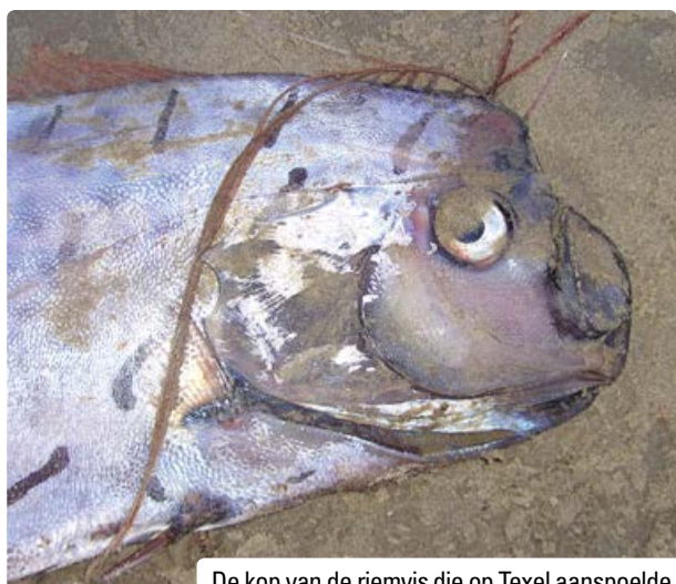
De kop van de riemvis die op Texel aanspoelde.

Deze wijdverspreide riemvisfoto kunnen we het beste als oorlogspropaganda beschouwen. In 1973 was de Vietnamoorlog nog in volle gang en was het Amerikaanse leger