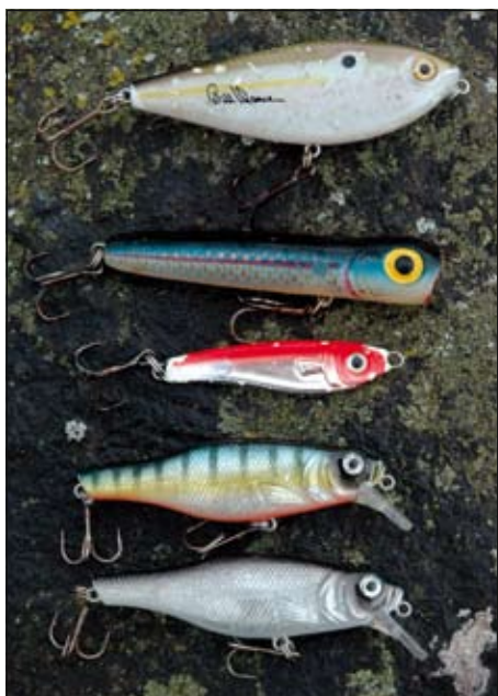
Twee van Michel's favoriete roofbleipoppers voor ondiep water: de Spitting Image van Excalibur en Chug Bug van Storm. In het midden het ver te werpen Killyfish pilkertje en daaronder twee zinkende plugjes, alledrie geschikt voor dieper water.