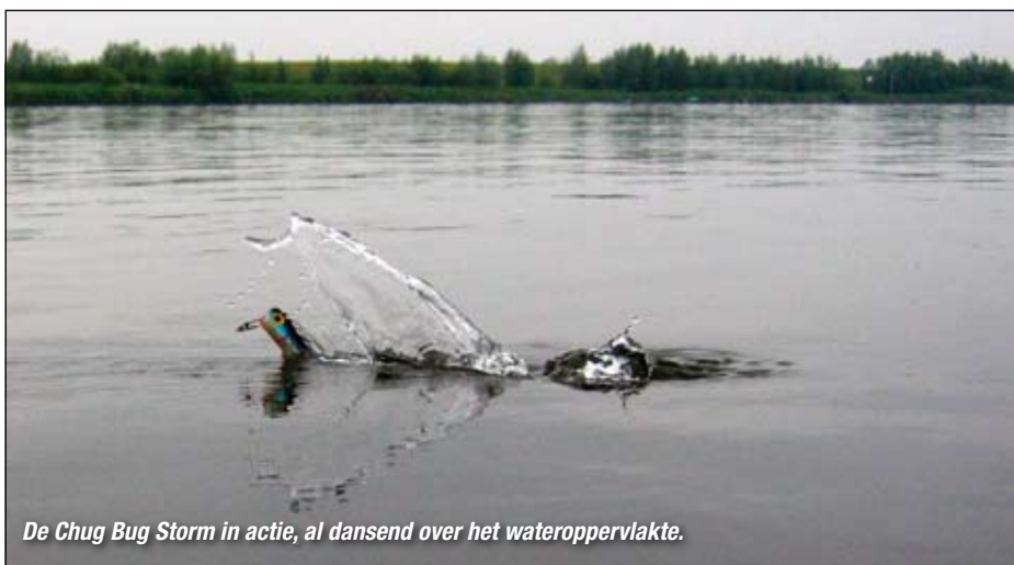
De Chug Bug Storm in actie, al dansend over het wateroppervlakte.

De 'Spitting Image' van Excalibur – een popper met een walk-the-dog actie én