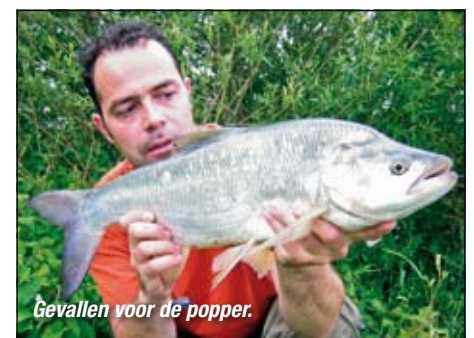
Gevallen voor de popper.

het eind van het seizoen. In mijn waadpak wandel ik tot mijn verbazing zo over de superstek. Het water komt niet hoger dan mijn knieën! Blijkbaar reageren roofbleien vooral goed op poppers op ondiep water – soms zelfs zo ondiep dat er geen enkele plug kan worden binnen gevist zonder dat deze de bodem aanharkt. De aantrekkingskracht van ondieptes is goed te verklaren. Visbroed waant zich er veilig en de (massale) aanwezigheid van aasvis trekt roofvis aan. Niet alleen roofblei, maar ook dikke windes en baarzen. Deze rovers sluipen vanuit dieper water het ondiepe op. Vaak heb je niet eens in de gaten dat ze er zitten. Totdat ze gaan jagen en vanuit het niets op je popper knallen, waarna de adrenaline full speed door je aderen pompt.