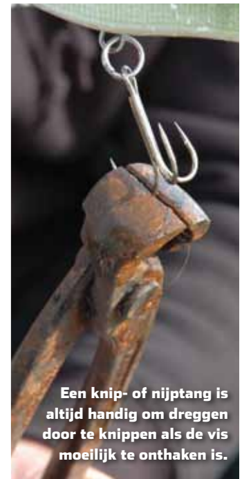
Een knip- of nijptang is altijd handig om dreggen door te knippen als de vis moeilijk te onthaken is.

Als er in het volgende uur alleen wat missers te noteren zijn, wordt besloten het over een andere boeg te gooien. Over de achterboeg om precies te zijn: we gaan trollen. Door het kunstaas al varend achter de boot aan te slepen, kam je snel en effectief een groot stuk water uit. Bob: “Daarbij is het belangrijk dat het kunstaas op de juiste afstand wordt gevist en mooi op half water loopt. Snoek is immers een vis die omhoog kijkt bij het jagen.” De stelregel is dat je diep lopend kunstaas dicht achter de boot vist, terwijl ondiep lopend kunstaas gerust wat verder achter de boot mag worden gesleept. Zolang je maar ongeveer halverwege tussen de bodem en het wateroppervlakte vist. “Een handige truc om te kijken of je in de goede richting zit, is om je kunstaas steeds verder achter de boot te trollen. Net zolang totdat je duidelijk tikken op je top krijgt van de