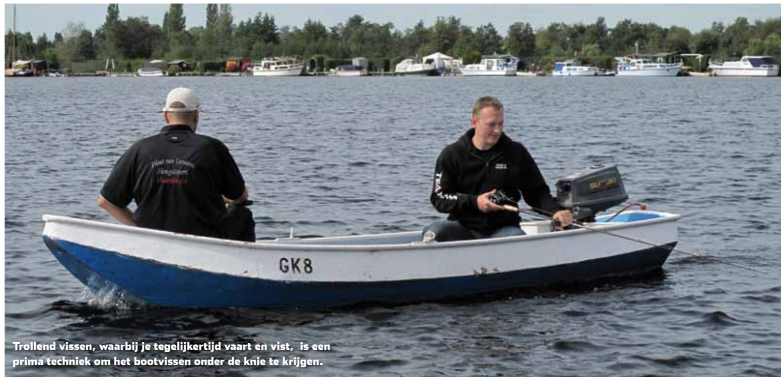
Trollend vissen, waarbij je tegelijkertijd vaart en vist, is een prima techniek om het bootvissen onder de knie te krijgen.

Bij fikse regen of golfslag komt er soms een laagje water in de boot te staan. Waterdichte schoenen of (warmte-) laarzen zijn daarom een aanrader.