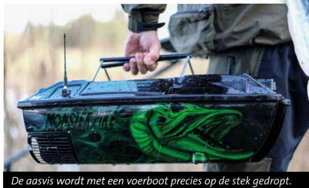
De aasvis wordt met een voerboot precies op de stek gedropt.