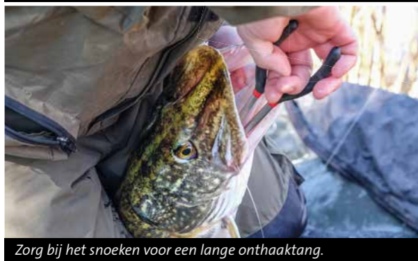
Zorg bij het snoeken voor een lange onthaaktang.