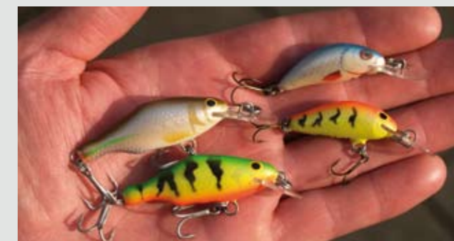
Kleine ondiep lopende plugjes die geschikt zijn om met een loodverzwaring 5 of 6 meter diep te laten lopen.