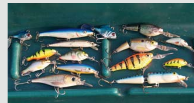
Een verzameling van mijn kunstaas waarmee ik op roofblei vis.