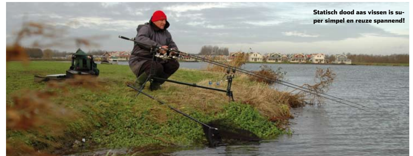
Statisch dood aas vissen is super simpel en reuze spannend!