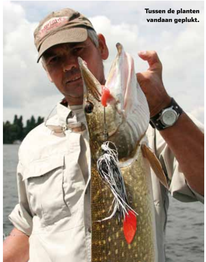
Tussen de planten vandaan geplukt.