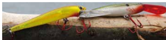
Overdag zijn diep lopende pluggen favoriet.

minder hard stroomt, zoals ingangen van zijtakken, havenmondingen en natuurlijk de kribben en tussengelegen kribvakken. De meest productieve perioden zijn de ochtend en avond. Overdag staat de zon hoog aan de hemel, loopt de temperatuur rap op, is er volop recreatie en scheepvaart en zijn de snoekbaarzen een stuk minder actief. Voor de beste resultaten moet je dus vroeg uit de veren of er juist pas laat weer in.