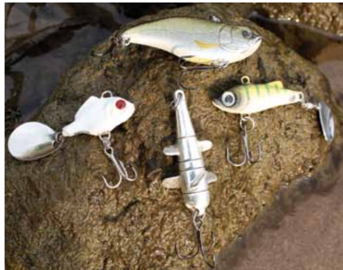
Vier toppers voor roofblei, met de klok mee: de Spro Aruku shad, Predox SpASPer, Devon spinner en Spro ASP spinner.

harde klappen op het wateroppervlak en de kenmerkende zwarte punten op de staartvin die boven water uitsteken. Ook visdiefjes kunnen je de roofblei als het ware aanwijzen: deze jagen vaak op exact dezelfde plekken. Soms zie je roofblei en visdiefjes zelfs letterlijk met elkaar concurreren om de aasvisjes! Toch hoef