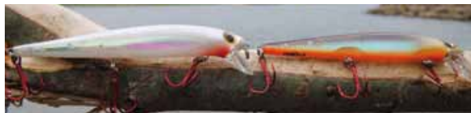
's Avonds kun je overschakelen op een ondieper lopende plug.