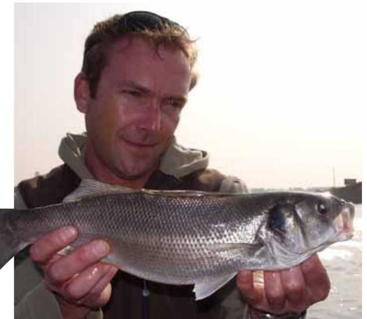
Zeebaars is, net als veel andere zoute rovers, niet vies van een werppilkertje.

vendien sport van de bovenste plank. Tenslotte is de vistech- niek met een werppilkertje erg eenvoudig; je kunt bijna niks fout doen. Zorg er wel voor dat je altijd vist als er een goede getijdenstroming staat. Vis dus met opkoment of afgaand tij en sla hoog- en laagwater lekker over. Dan staat er namelijk amper stroming en is de vis veel minder actief.