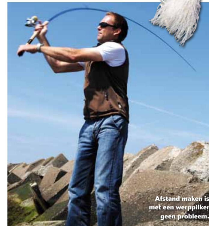
Afstand maken is met een werppilker geen probleem.

er dan goed aan om te kiezen voor een simpele montage die overal toepasbaar, gemakkelijk te vissen en voor vrijwel alle zoute rovers interessant is. Dan heb ik het over vissen met een licht werppilkertje, met