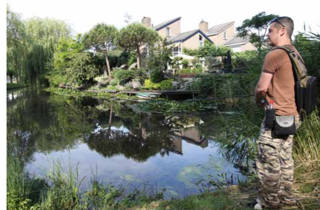
Licht bepakt en mobiel is het credo bij het vissen in stadswateren.

TEKST CARL GREVE