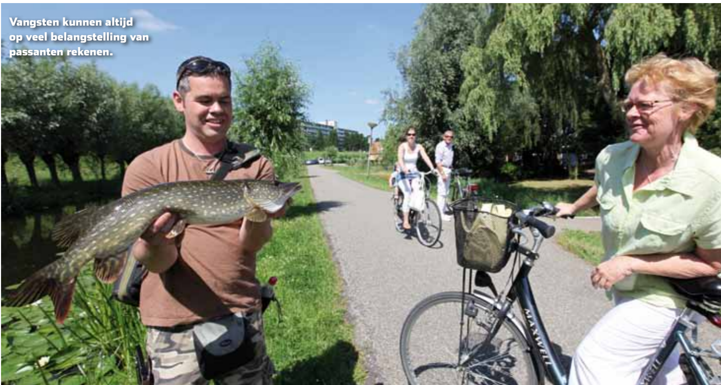
Vangsten kunnen altijd op veel belangstelling van passanten rekenen.

ik een Shimano Stradic 2500 die is opgespoeld met een gevlochten lijn van om en nabij 16/00. Gezien het feit dat je niet met heel zwaar aas aan de slag gaat, is deze lijndikte voldoende om lekker en effectief te kunnen vissen. Ik houd van ronde, slijtvaste lijnen die ook nog eens dicht bij de dikte komen die ze opgeven op het doosje.