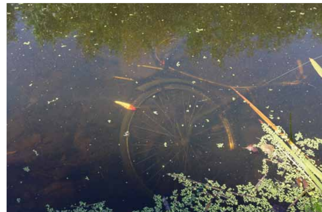
Het stadswater heeft zo zijn eigen soort obstakels waarin je kunstaas kan blijven hangen.

Als je op pad gaat met zo min maar ook divers mogelijk materiaal, is het belangrijk dat je de hengel en molen zo universeel mogelijk kiest. Mijn voorkeur gaat daarom uit naar een middenmaat spinhengel met bijpassende molen. Daarmee kun je zowel een lichte spinnerbait als een kleine jerkbait en alles wat daartussen zit vissen zonder veel concessies te doen aan gevoel of kracht en – zeker niet onbelangrijk – de uiteindelijke sport. Bovendien beperk ik me zo niet tot één vissoort, maar houd ik alle opties open en de kans op resultaat zo groot mogelijk. Mijn hengelkeuze valt op een Shimano Diaflash van 2.40 meter met een werpgewicht tot dertig gram. Daarop zet