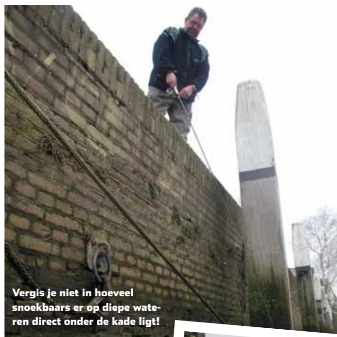
Vergis je niet in hoeveel snoekbaars er op diepe wateren direct onder de kade ligt!