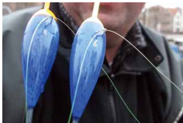
Vervolgens zet je een 6- of 8-grams schuifdobber op de lijn.