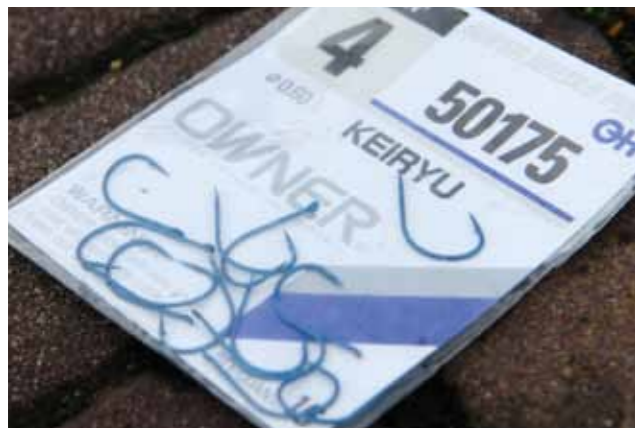
En tot slot een klauwhaak maat 4 met brede haakbocht.