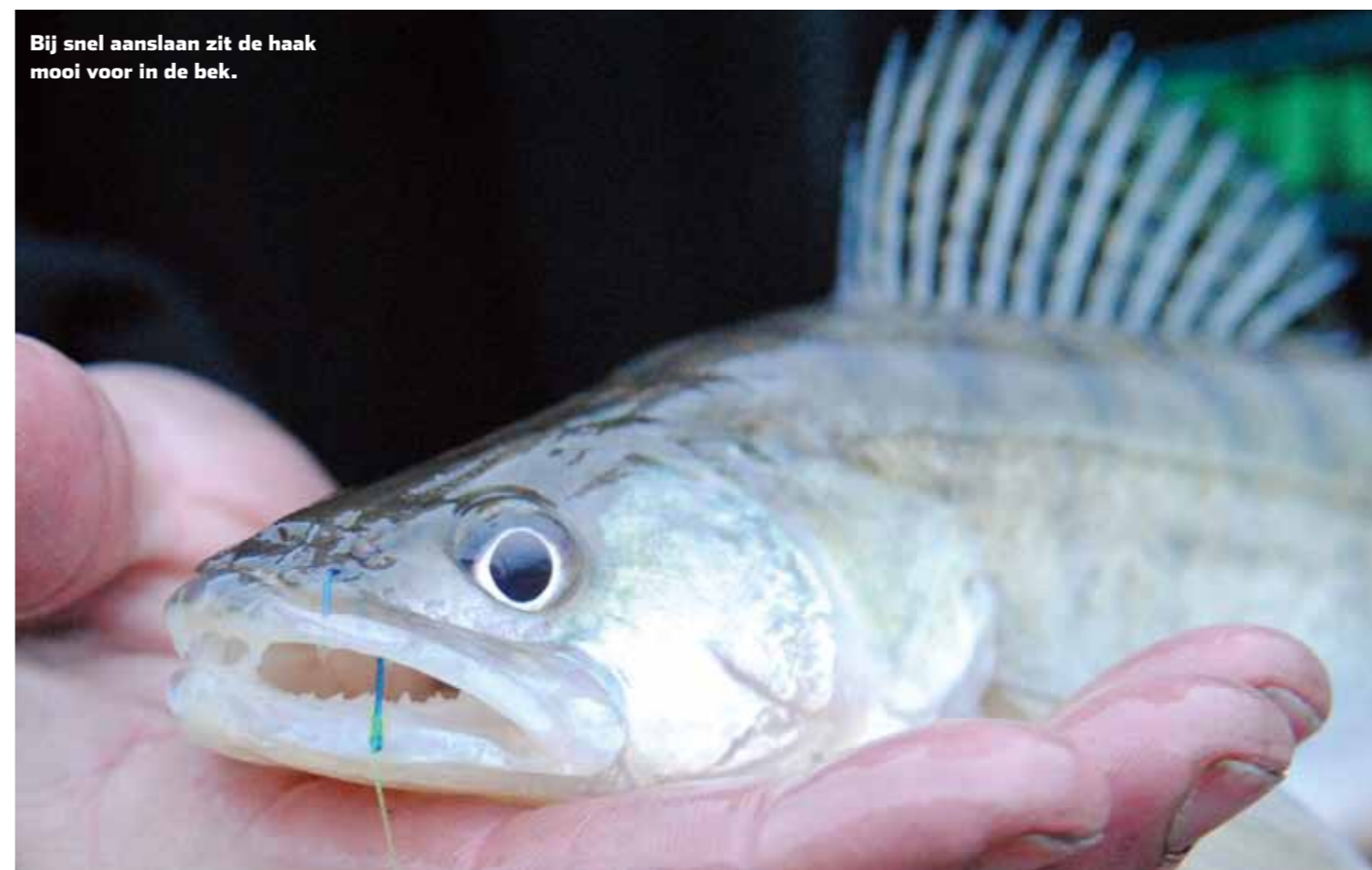
Bij snel aanslaan zit de haak mooi voor in de bek.