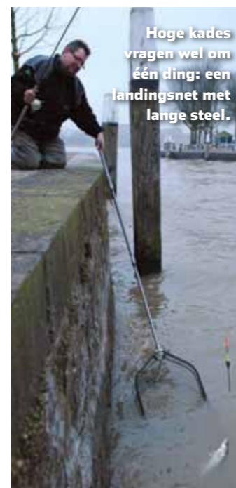
Hoge kades vragen wel om één ding: een landingsnet met lange steel.

In het zijhaventje waar we vissen, staat onder de kade goed drie meter water. “Dat is zeker in het voorjaar en de zomer een prima diepte. In de koude winterperiode zijn de kantjes vaak wat minder productief, omdat veel vis zich dan verder uit de kant in het diepere ophoudt. Maar met maart voor de boeg – en zeker ook direct na de gesloten tijd – is een paar meter water meer dan genoeg om direct onder het kantje volop snoekbaars te vangen”. Dat geldt hier, maar eigenlijk voor alle Nederlandse rivieren, kanalen, vaarten en