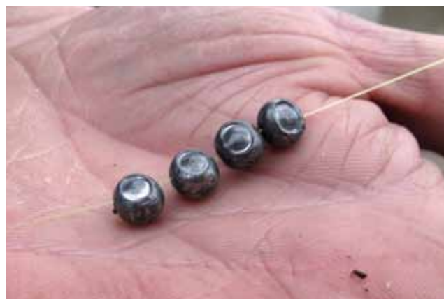
Onder de schuifdobber monteert je 4 of 5 SSG loodhagels.