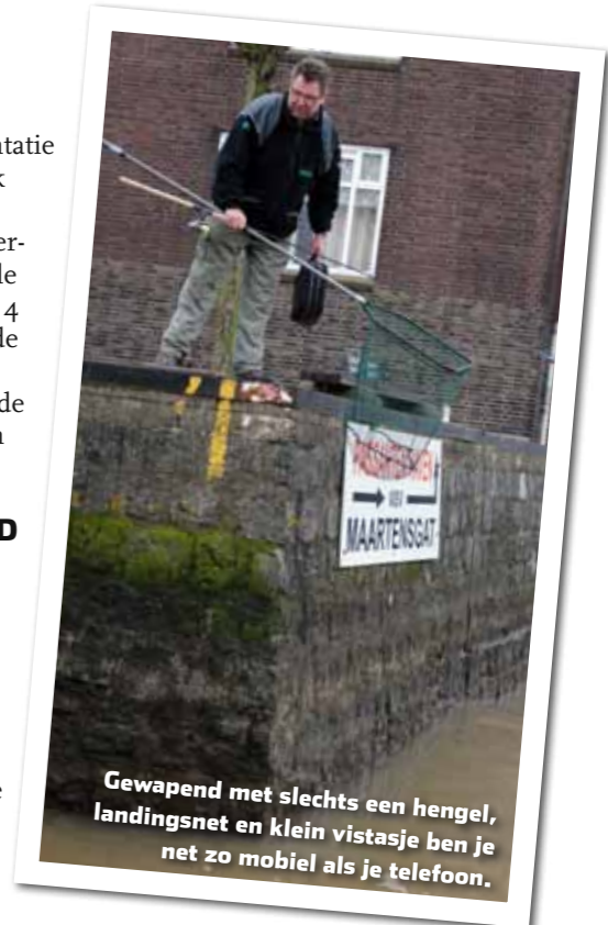
Gewapend met slechts een hengel, landingsnet en klein vistasje ben je net zo mobiel als je telefoon.

stinken, of in dit geval een extra sterk ruikend aasvisje: het werkt gewoon altijd”, aldus Lubbers. De spiering monteert hij door de haak in de bek te steken en deze via de bovenkant naar buiten te rijgen. Eén haak, ook nog eens tamelijk verstopt, is vol-