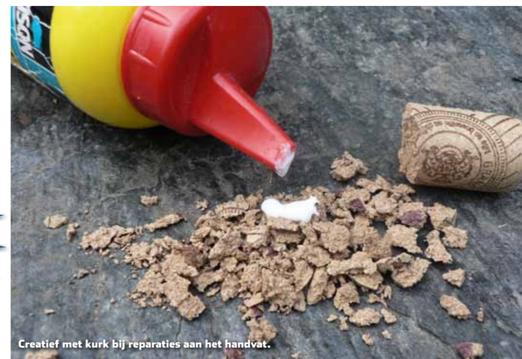
Creatief met kurk bij reparaties aan het handvat.

Tenslotte onderwerpen we ook het kunstaas aan een onderhoudsbeurt. Dit betreft