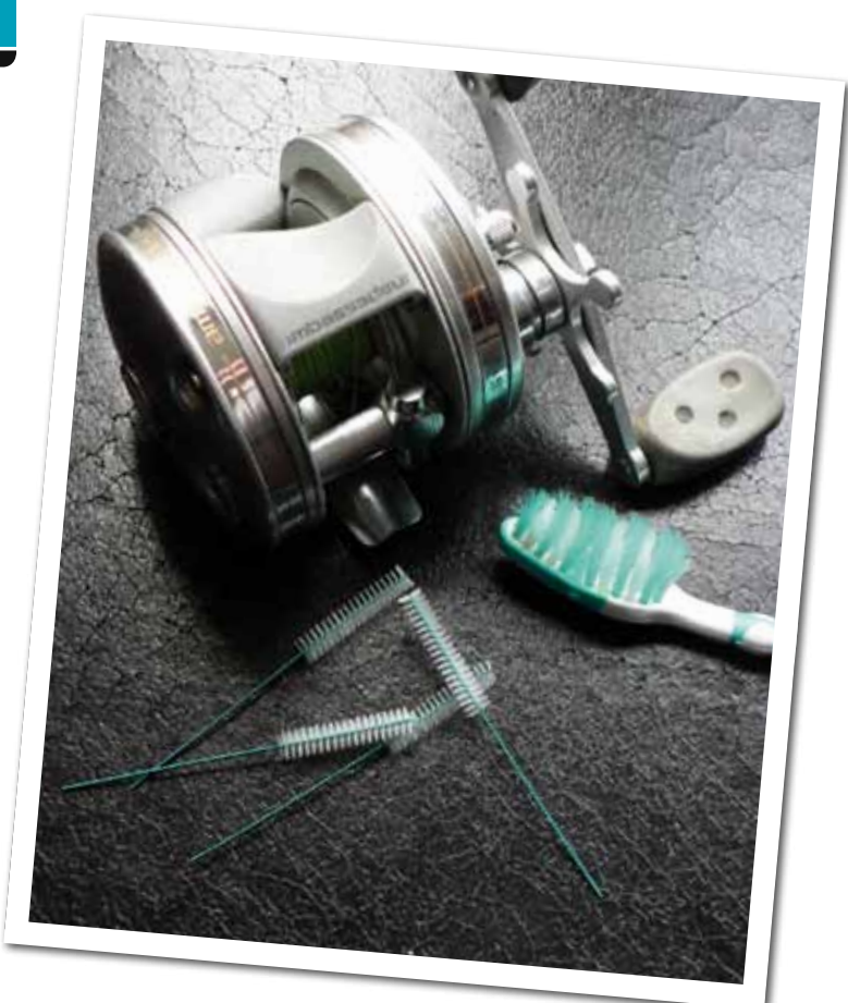
Handige tools voor een stralend schone molen of reel.

Natuurlijk weet ik dat de bovenstaande tips de meeste roofvissers wel min of meer bekend zijn. Je hebt het misschien al eens gelezen of eerder gehoord, dat van het onderhoud van je visspullen