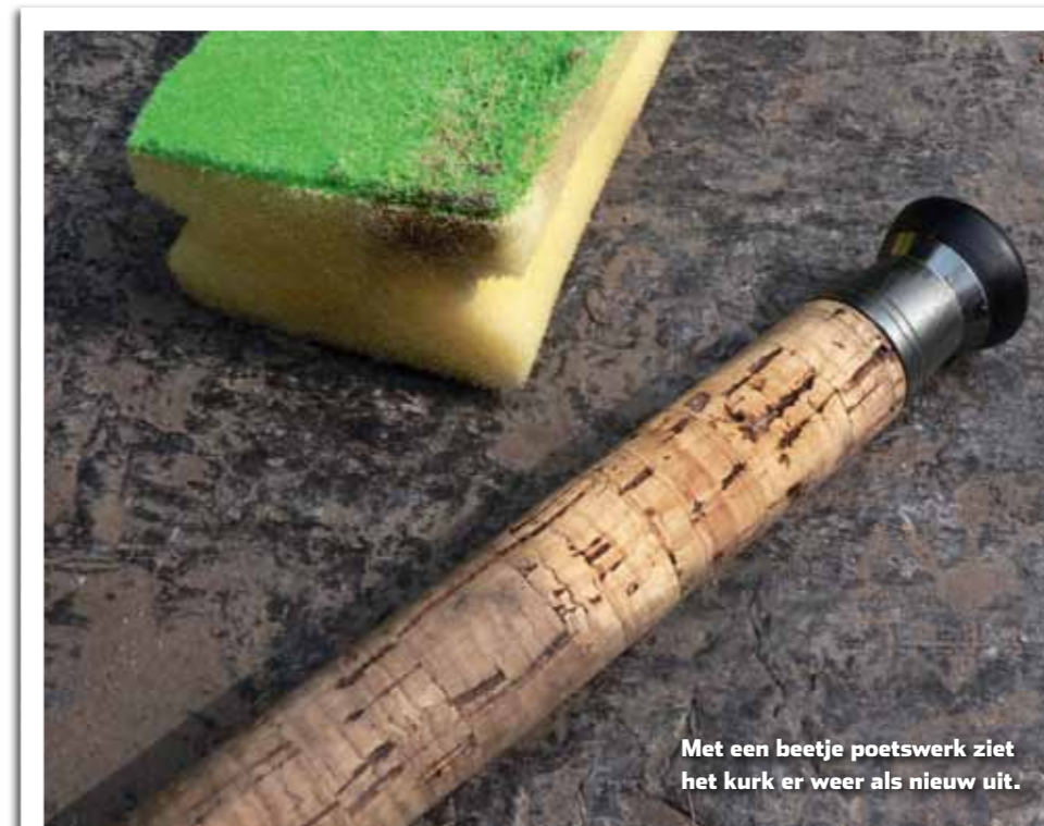
Met een beetje poetswerk ziet het kurk er weer als nieuw uit.

De molen of reel maak je met wat lauw water en een oude tandenborstel goed schoon. Voor de echt hele kleine hoekjes en gaatjes kun je prima gebruik maken van de ragertjes (spiraalborsteltjes) waarmee je ook je gebit reinigt. Deze zijn mooi klein en passen nog in de meest minuscule openingen. Deze ragertjes kun je trouwens ook heel goed rond de ogen van de hengel, op het punt waar ze op de blank zijn gemonteerd, gebruiken. Daar wil zich namelijk ook nog wel eens wat vuil verzamelen waar je in de regel moeilijk bij kunt. Alle draaiende delen van reel of molen worden voorzien van een paar druppeltjes olie. Gebruik hier altijd de wat dunnere olie voor, bijvoorbeeld naaimachineolie of de