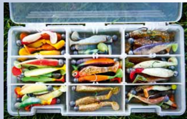
Shads en twisters met felle kleurtjes zijn top voor het 'oeverwerk'.