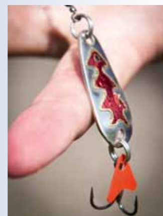
'Good old' lepels en spinners zijn ware baarskillers.