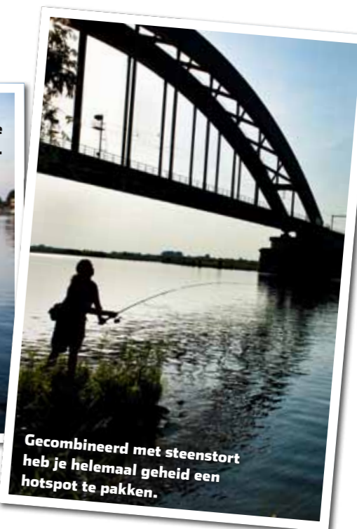
Gecombineerd met steenstort heb je helemaal geheid een hotspot te pakken.