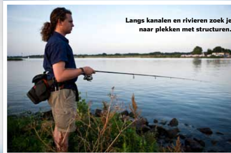
Langs kanalen en rivieren zoek je naar plekken met structuren.