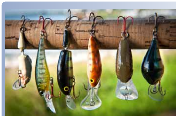
Kies plugjes met diverse duikdieptes en vis deze in verschillende tempo's binnen.

of titanium onderlijntje. Baars en snoek leven nu eenmaal naast elkaar. De plekken die goed zijn voor baars, zijn vaak ook goed voor snoek. Ook in de zomermaanden. Er valt kortom genoeg te proberen en te ontdekken. De baarzen zullen je wel laten weten of je het goed doet! <