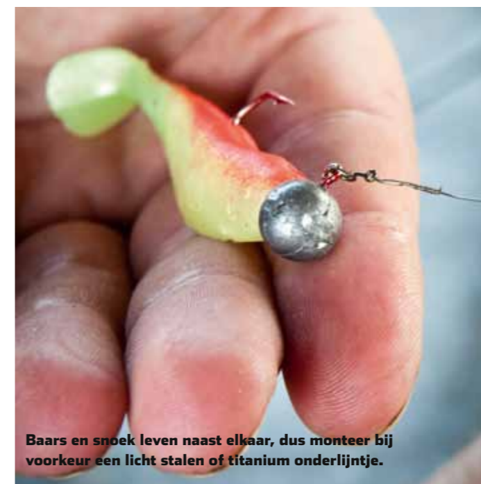
Baars en snoek leven naast elkaar, dus monteer bij voorkeur een licht stalen of titanium onderlijntje.

nen in de laatste jaren. Dit heeft er voor gezorgd dat er tegenwoordig een grote keus is aan verschillende aasjes die fantastisch zijn om mee op baars te vissen. Met name de Japanse kunstaasfabrikanten als Lucky Craft, Megabass en Evergreen maken verschrikkelijk mooie aasjes voor dit doel, al zijn deze vaak wel moeilijk te verkrijgen. Iets voor de echte genietter, zullen we maar zeggen.