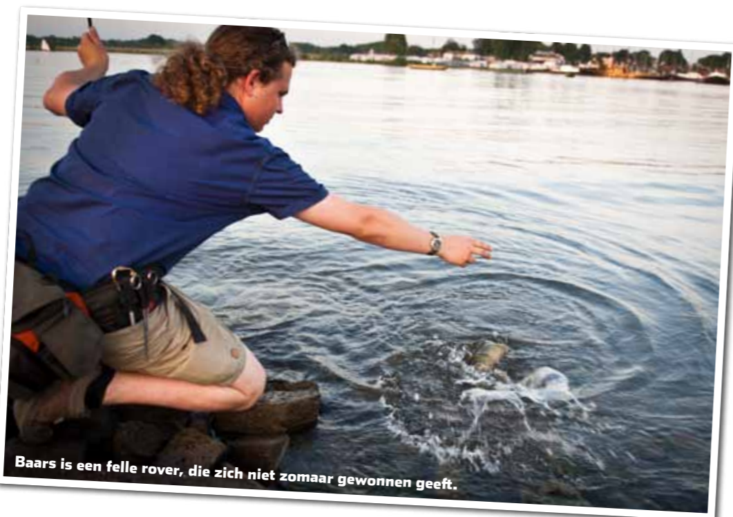
Baars is een felle rover, die zich niet zomaar gewonnen geeft.

Baarzen zijn verzot op oppervlakte kunstaas. Poppers, propdarters en walk-the-dog-aasjes zijn supereasjes voor de zomerbaarzen. Eén van de meeste spectaculaire kunst-aasvisserijen in ons land! Oppervlakte kunstaas heeft veel aan populariteit gewon-