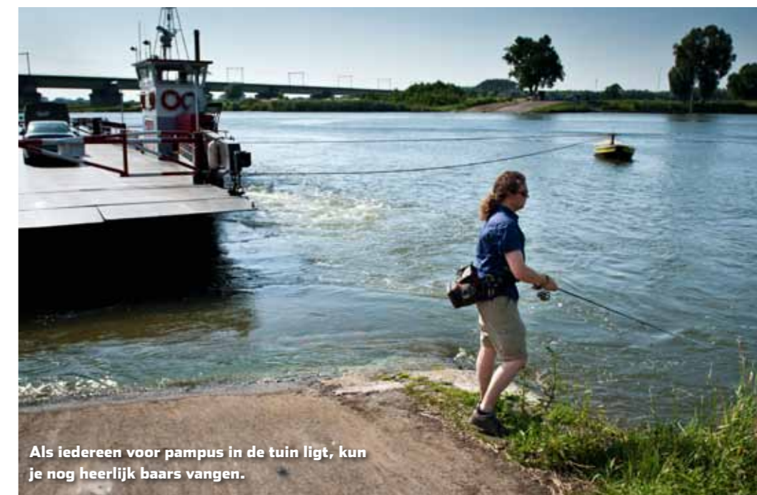
Als iedereen voor pampus in de tuin ligt, kun je nog heerlijk baars vangen.