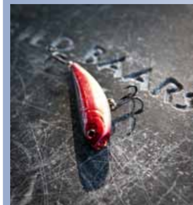
Kleine poppertjes: als je ze erop krijgt de meest spectaculaire manier van baarsvissen!