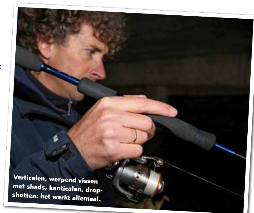
Verticalen, werpend vissen met shads, kanticalen, dropshots: het werkt allemaal.

passen geblazen. De combinatie van drukke scheepvaart en harde stroming is al helemaal een afrader voor de bellyboat. Het komt dus echt aan op het gebruik van je gezonde verstand of je hiermee het water op gaat. Probeer de situatie en de risico's ter plekke goed in te schatten. Op waterwegen waar alleen de pleziervaart gebruik van maakt, heb je dit probleem 's winters niet. Die is dan immers zo goed als verdwenen.