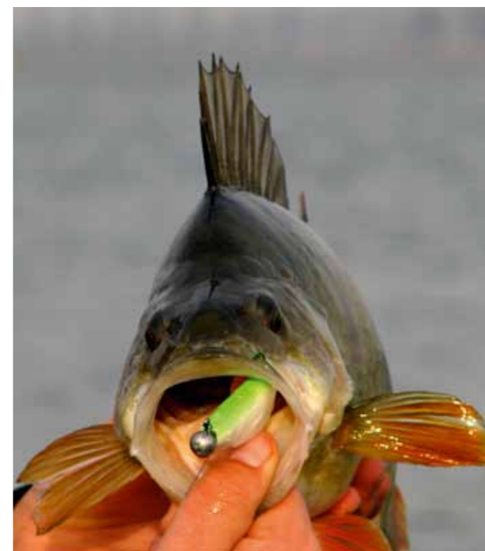
Door de lichte loodkop zuigt de roofvis het aas als het ware op en is een staartdregje niet nodig.

In principe zijn alle typen shads prima op een lichte