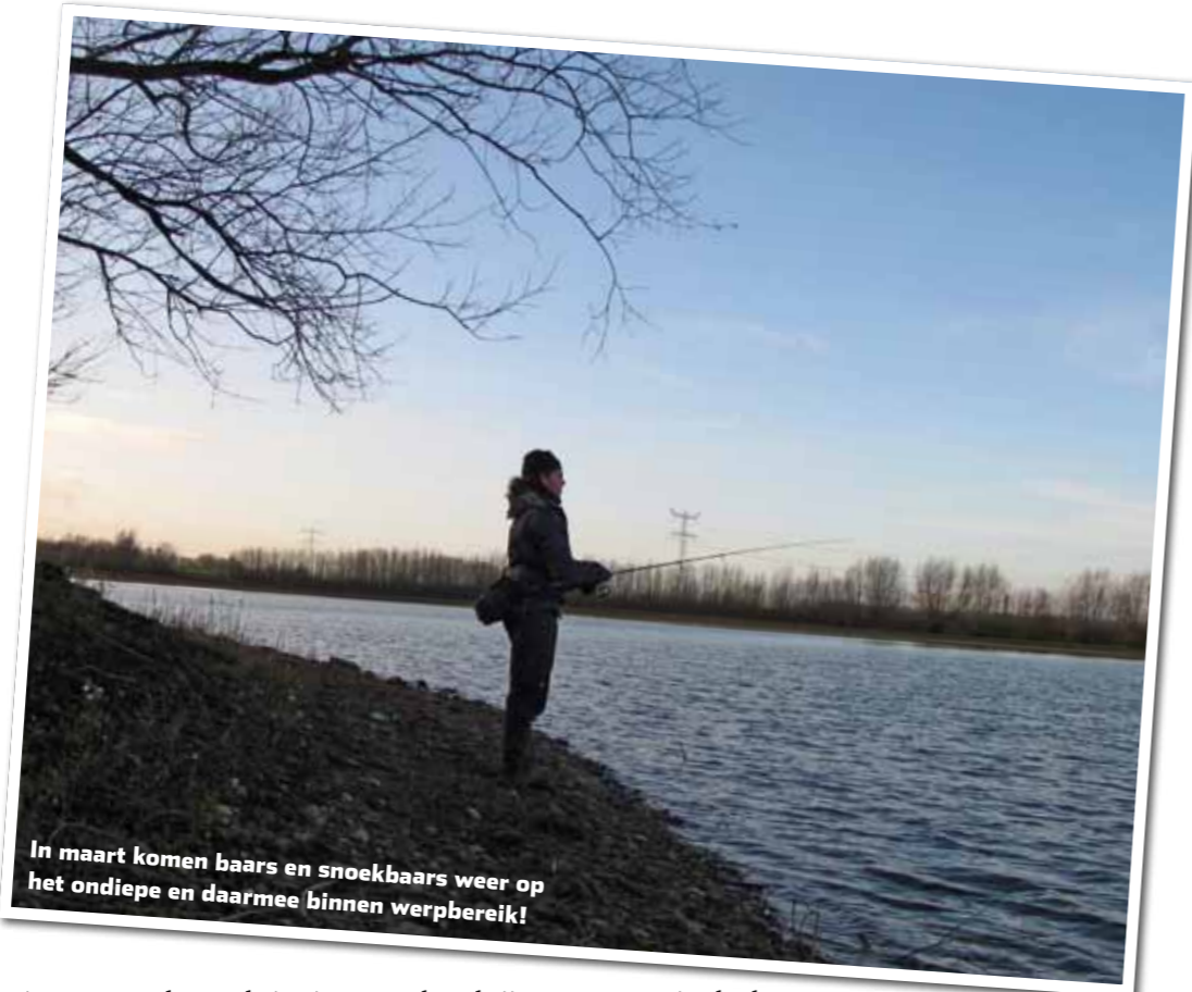
In maart komen baars en snoekbaars weer op het ondiepe en daarmee binnen werpbereik!

Ultralichte loodkoppen van 2 tot 7 gram geven de shadvissers een compleet nieuwe dimensie.