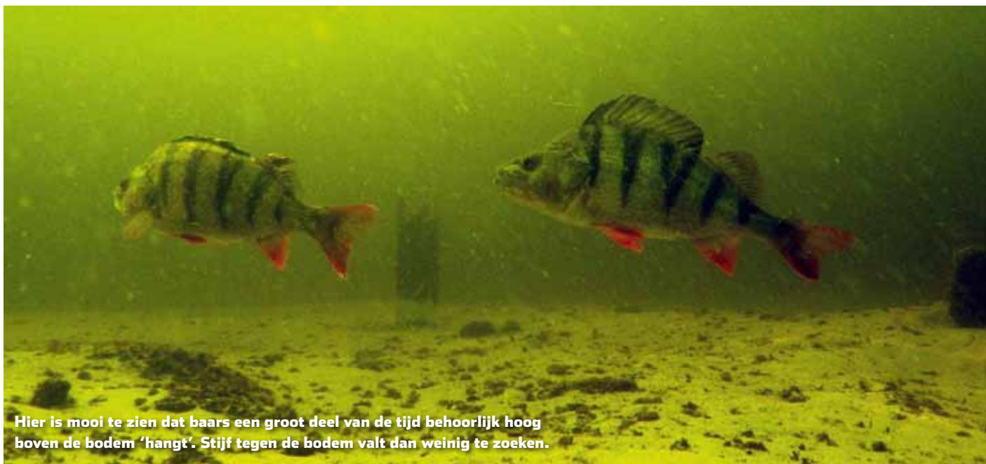
Hier is mooi te zien dat baars een groot deel van de tijd behoorlijk hoog boven de bodem 'hangt'. Stijf tegen de bodem valt dan weinig te zoeken.

met een zware loodkop en ga steeds een stapje lichter. Net zo lang tot je echt niet meer lichter kunt. Je zult zien dat je gaandeweg steeds lichter en lichter kunt gaan vissen. Feitelijk ga je op zoek naar het langste zweefmoment, want de meeste aanbeten komen tijdens het moment dat je shad boven de bodem zweeft. Niets is zo mooi als het ogenblik dat vanuit het niets die dikke vis op je rustig zwevende shadje tikkert. En geloof me: juist de dikke jongens zijn hier erg gevoelig voor. Koop een handje lichte loodkoppen en scherp je techniek aan. Het zal je geen windeieren leggen!