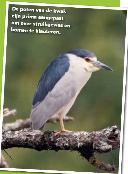
De poten van de kwak zijn prima aangepast om over struikgewas en bomen te klauteren.