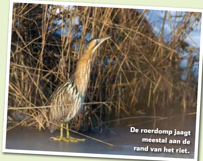
De roerdomp jaagt meestal aan de rand van het riet.

Roerdampen broeden in moerassen die rijk zijn aan stevig, oud riet. Vissen, kikkers, grote insecten en – vooral 's winters – muizen vormen de belangrijkste voedselbron. Het aantal broedparen in Nederland neemt al decennialang langzaam maar zeker af. De belangrijkste redenen daarvoor zijn het verdwijnen van geschikt leefgebied, een afname van de visstand in bepaalde broedgebieden en verstoring door recreatie. De belangrijkste overgebleven broedplaatsen liggen in Noordwest-Overijssel, de Oostvaardersplassen en het Gelderse Rijnstrangengebied.