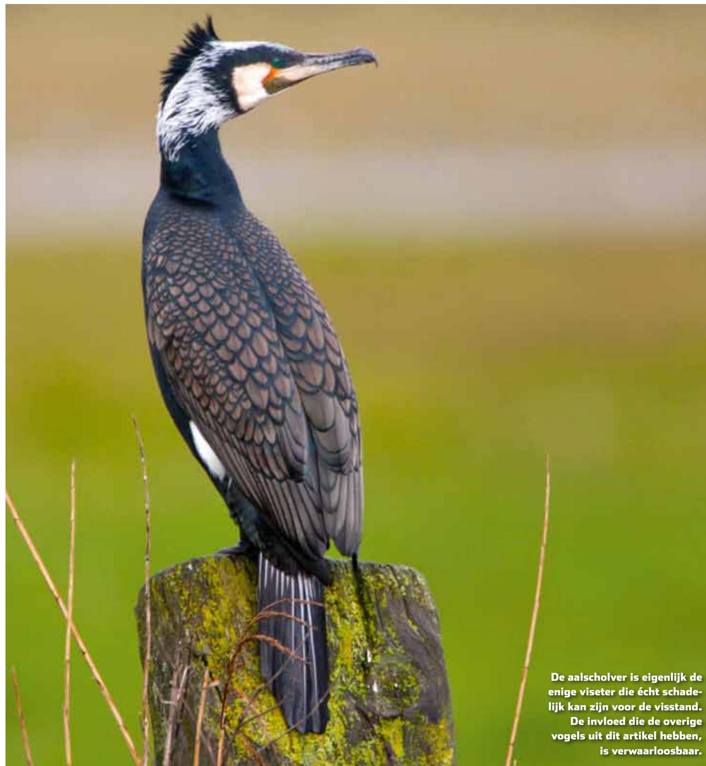
De aalscholver is eigenlijk de enige viseter die écht schadelijk kan zijn voor de visstand. De invloed die de overige vogels uit dit artikel hebben, is verwaarloosbaar.