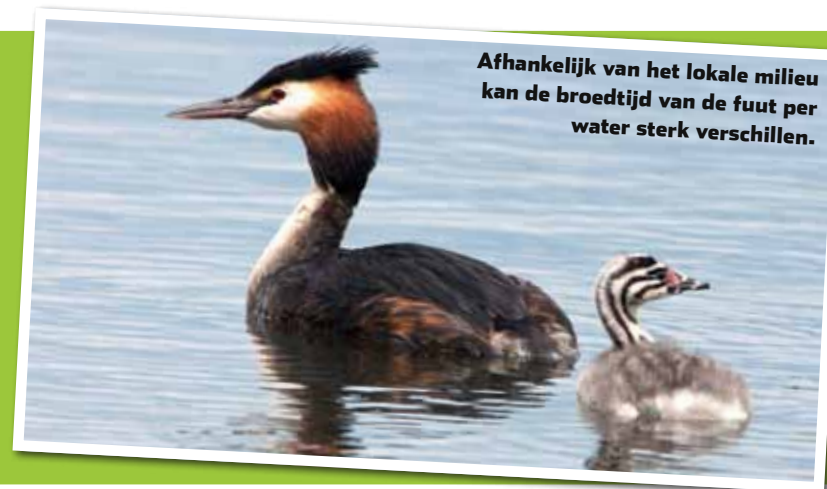
Afhankelijk van het lokale milieu kan de broedtijd van de fuut per water sterk verschillen.

Qua aantallen de meest voorkomende visetende watervogel van Nederland. Je vindt hem bij vrijwel alle meren, plasjes, sloten, grachten, parken en vaarten. Weinig mensen weten dat de fuut tot de jaren '60 van de vorige eeuw nog helemaal niet zo'n algemene verschijning was in Nederland. Destijds werd het aantal broedparen geschat op slechts drieduizend. Het aantal futen kan nog wel eens fluctueren, afhankelijk van strenge winters met vorst. Tijdens zulke winters treden meestal grote concentraties futen op bij belangrijke overwinteringsgebieden, zoals het IJsselmeer, de Randmeren en het Deltagebied. Daar blijft het water immers ook bij strenge vorst meestal voor een behoorlijk deel vrij van ijsvorming.