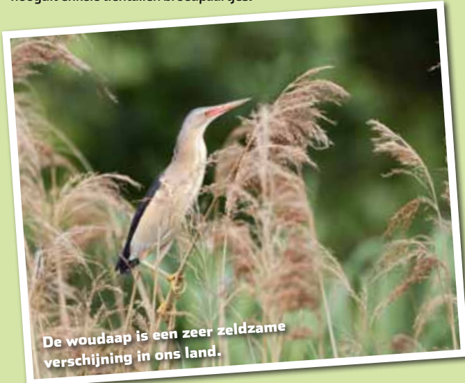
De woudaap is een zeer zeldzame verschijning in ons land.

Woudaapjes zijn kleine moerasvogels die leven van visjes, amfibieën en insecten. Ze broeden vooral in dichte rietkragen en ruigtes met wilgen. De wintermaanden brengen ze door in tropisch Afrika. Woudaapjes leiden een zeer verborgen leven. De kans om er aan de waterkant eentje tegen te komen, is dan ook nihil. Tot in de jaren '50 van de vorige eeuw broedden nog honderden woudaapjes in ons land. Tegenwoordig gaat het nog slechts om hooguit enkele tientallen broedpaartjes.