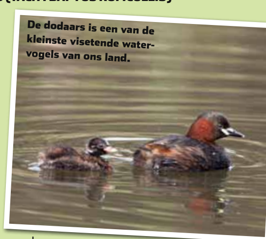
De dodaars is een van de kleinste visetende watervogels van ons land.

Dodaarsen leven van kleine visjes, schelpdieren en – vooral in de broedtijd – waterinsecten. De dodaars is net als alle fuutachtigen een echte zichtjager. Het water mag dus niet té troebel zijn. Dodaarsen komen hier het hele jaar rond voor. Al zijn er ook dodaarsen uit noordelijker gelegen gebieden die Nederland gebruiken als overwinteringsgebied.