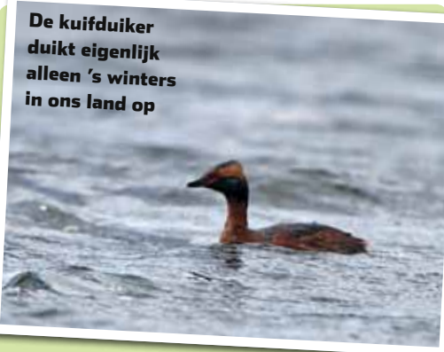
De kuifduiker duikt eigenlijk alleen 's winters in ons land op

ten van Europa uitgedroogd raken, zoeken ze broedgebieden in West-Europa op, waaronder Nederland. Alhoewel het een viseter is, willen de rollen bij deze vogel ook nog wel eens omgedraaid zijn: jonge geoorde fuutjes vallen niet zelden ten prooi aan snoeken.