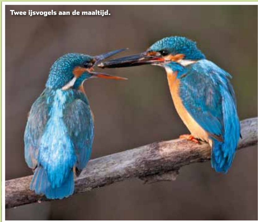
Twee ijsvogels aan de maaltijd.

Tijdens het vissen een ijsvogeltje voorbij zien vliegen, komt toch wel in de buurt van het gevoel van ultiem geluk. Alle gekheid op een stokje; dit felblauw gekleurde visetertje is een schitterende verschijning. En juist sportvissers – die voor langere tijd langs de waterkant zitten – zien ze opvallend vaak voorbij scheren, vaak laag over het water. De vogel heeft een voorkeur voor visrijk en helder water met steile oevers. Vooral beken zijn erg in trek. De aanwezigheid van hoge, zandige, kleiige of lemige oevers is een vereiste, omdat de ijsvogel daarin de nesttunnel uitgraaft. Strenge winters met ijsvorming, het kanaliseren en uitdaging van beeklopen en vertroebeling van het water het ijsvogeltje de das om doen. Gelukkig lopen er diverse herstelprojecten, zoals het 'Project IJsvogel'.