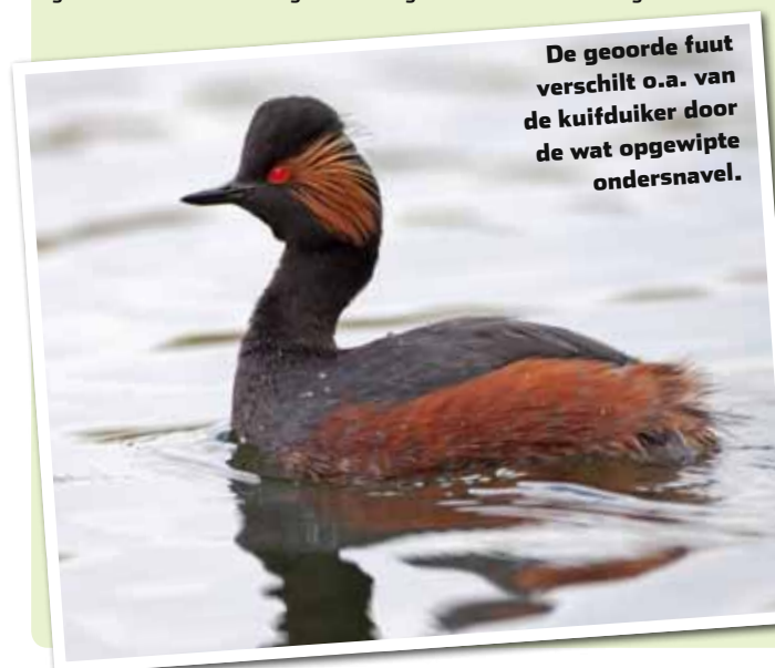
De geoorde fuut verschilt o.a. van de kuifduiker door de wat opgewipte ondersnavel.

De geoorde fuut is kleiner dan de gewone fuut. Hij broedt in kolonies in kleine zoetwaterplasjes (zoals duinplasjes) en heidevennen. Niet zelden broeden ze op dezelfde plekken als de kokmeeuw, maar een verklaring waarom ze exact dezelfde biotoop is nog niet gevonden. De geoorde fuut heeft een zigeunerachtig karakter. Als de broedgebieden in het zuiden en zuidoos-