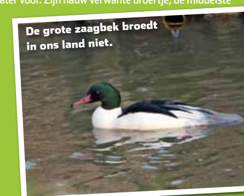
De grote zaagbek broedt in ons land niet.

In Nederland zien we de grote zaagbek vooral op de grote en middelgrote plassen en meren. Omdat zijn oorspronkelijke leefgebied – langzaam stromende rivieren met bossen en oude bomen eromheen – hier nauwelijks meer voorkomt, zijn het vooral de overwinteraars die we in ons land zien. Het IJsselmeer, het Vechtplassengebied en natuurgebieden langs de grote rivieren zijn belangrijke overwinteringsgebieden voor de grote zaagbek. Hij komt alleen bij zoet water voor. Zijn nauw verwante broertje, de middelste zaagbek, komt overigens wél ook voor op zout water – met name in zeehavens. Net als de middelste zaagbek (die iets kleiner, maar wel bonter van kleur is) is hij te herkennen aan een haakje vooraan de bovensnavel. Deze dient om vis vast te klemmen.