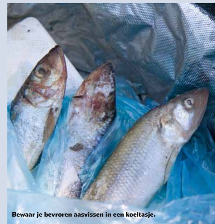
Bewaar je bevroren aasvissen in een koeltasje.

In de zomermaanden barst het op veel wateren van de kleine witvis. Omdat de snoek dan vaak overschakelt op klein aas, kun je de grote makrelen, mega-voorns en andere grote aasvissen met een gerust hart thuis laten. Denk vooral in termen van kleine blankvoorns, kolbleitjes, spiering, sardines en haringen van 10 tot max. 15 cm. Dit slag aasvissen is groot genoeg om zelfs de dikste metersnoeken te verleiden. Vergeet ook niet om je bevroren aasvissen in een koeltasje te bewaren. Aangezien sommige aasvissen in ontdooide toestand erg zacht en slap worden (denk aan sardine), kun je ze beter bevroren meenemen en zo koel mogelijk bewaren. In het warme water is je aasvis toch zo ontdood.