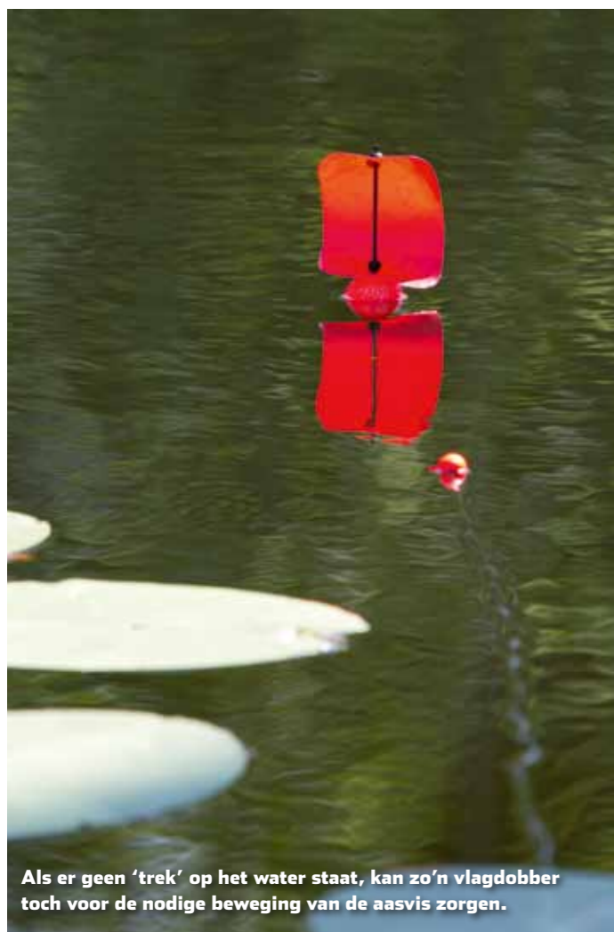
Als er geen 'trek' op het water staat, kan zo'n vlagdobber toch voor de nodige beweging van de aasvis zorgen.