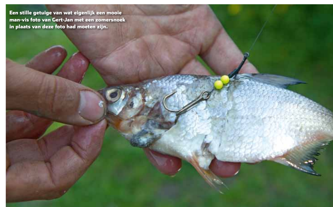
Een stille getuige van wat eigenlijk een mooie man-vis foto van Gert-Jan met een zomersnoek in plaats van deze foto had moeten zijn.