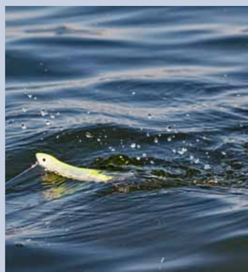
Spitting stickbaits hebben een holle neus en 'spugen' een klein beetje water.