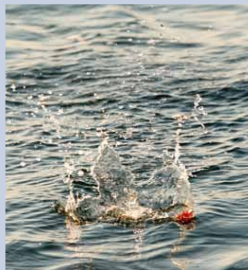
De popper vis je met felle, korte rukken en is vanwege zijn 'holle' schoep een echte herriemaker.

oktober vaak uitzonderingen. De baarzen jagen nu volop om aan te sterken voor hun terugreis naar het zuiden. En juist in die periode doet het (grote) oppervlaktekunstaa vaak niet onder voor andere varianten. Soms moet je even doorbijten voordat je succes boekt, maar als je één keer een aanval van een zeebaars op je plug meemaakt is het pleit beslecht en ben je voorgoed om.