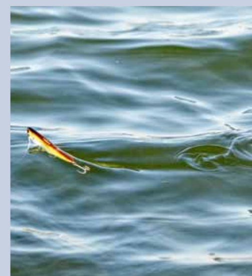
Stickbaits hebben geen schoep of duiklip en vis je met een zigzag actie (walking the dog) binnen.