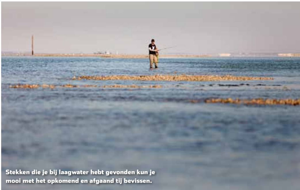
Stekken die je bij laagwater hebt gevonden kun je mooi met het opkomend en afgaand tij bevissen.