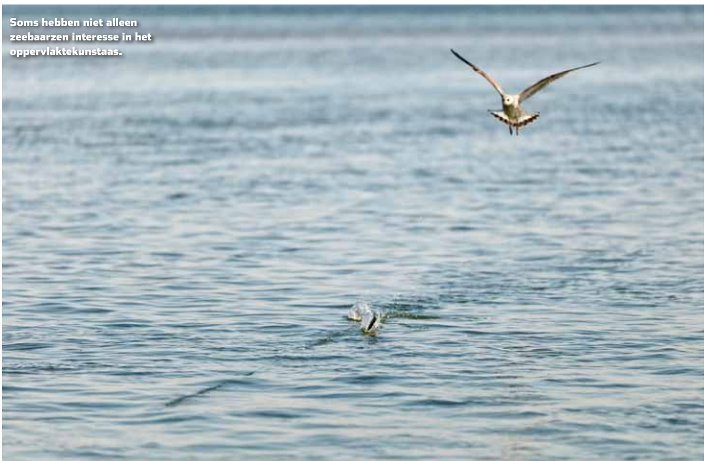
Soms hebben niet alleen zeebaarzen interesse in het oppervlaktekunstaas.

zuidwestenwind en de nodige bewolking aan de hemel, dan heb je de ideale omstandigheden voor de zeebaarsvisserij. Actief water voor actieve vis. Als jij dan een mooie actie aan een oppervlakteplug weet te geven, moet het gek lopen wil je niet verslingerd raken aan de oppervlaktevisserij.