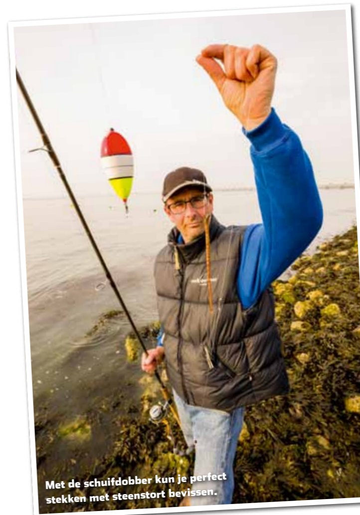
Met de schuifdobber kun je perfect stekken met steenstort bevissen.

Als aas gebruik ik erg graag steekzagers, maar ook mesheften en zachte krab zijn favoriet – zowel voor de bodemvisserij als het vissen met een dobber. Op de zachte krab na, kun je deze aassoorten kakelvers in de handel vinden. Voor de diehards onder ons zijn er ook mogelijkheden zat om