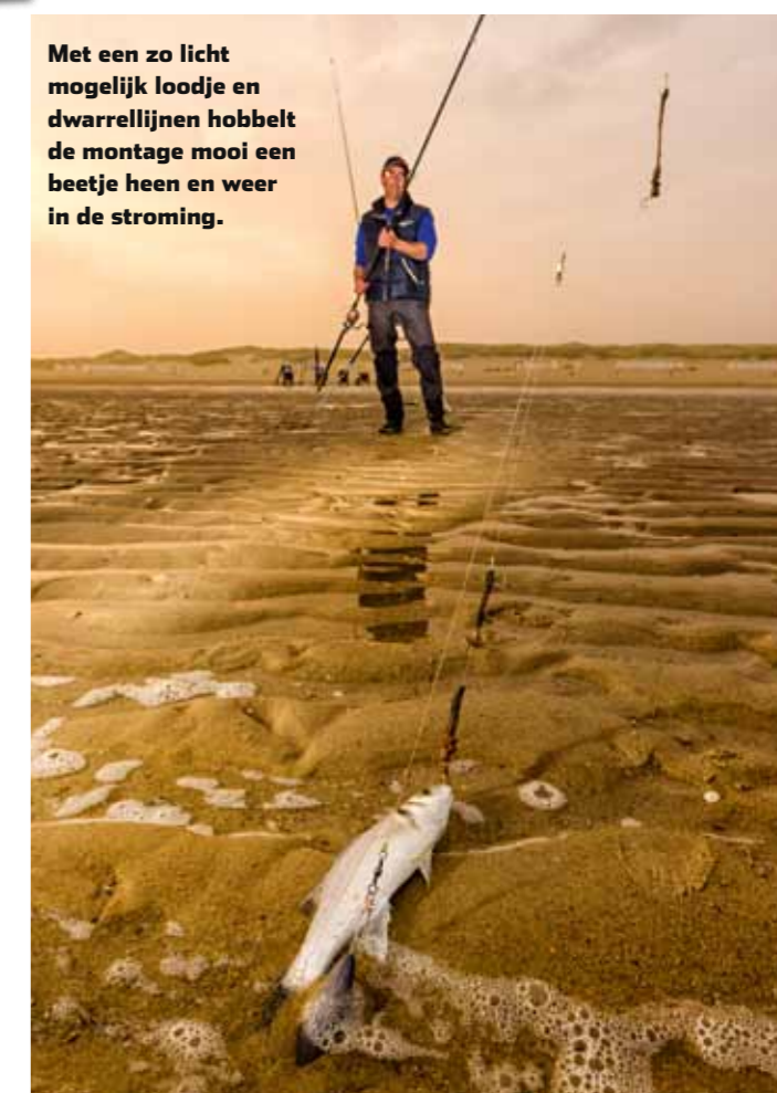
Met een zo licht mogelijk loodje en dwarrellijnen hobbelt de montage mooi een beetje heen en weer in de stroming.

vervolgens op de stroming in de buurt van de bodem binnen te vissen. Het is hierbij heel erg belangrijk om het gewicht van de jiggkop aan te passen aan de snelheid van de stroming. Vis je te zwaar, dan 'valt' de shad door de stroming en hang je vaak vast. Te licht is ook niet goed, want dan haal je nauwelijks de beoogde diepte en toont de zeebaars amper of geen interesse. Lukt het je om de shad op de stroming in de buurt van de bodem te laten driften zonder constant vast te hangen – geen sinecure als je onge oefend bent – dan kan succes niet uitblijven.