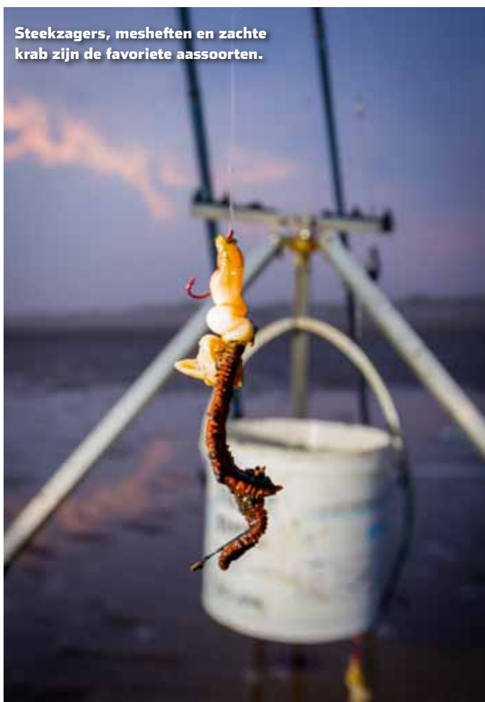
Steekzagers, mesheften en zachte krab zijn de favoriete aassoorten.

zelf je portie aas bij elkaar te scharrelen. Geen gek idee, want de regel is: hoe verser, hoe beter! Vervolgens is het een kwestie van je aas op de juiste plek aanbieden. Voor een goede zeebaarsstek op het strand moet je soms even zoeken – naar de aanwezigheid van muien en zwinnen – maar er zijn ook hotspots die je niet kunt missen – steenpartijen in de vorm van golfbrekers en palenrijen. Dit zijn plaatsen waar zich voedsel in de vorm van aasvisjes, krabben en allerhande schaaldieren schuilhoudt.