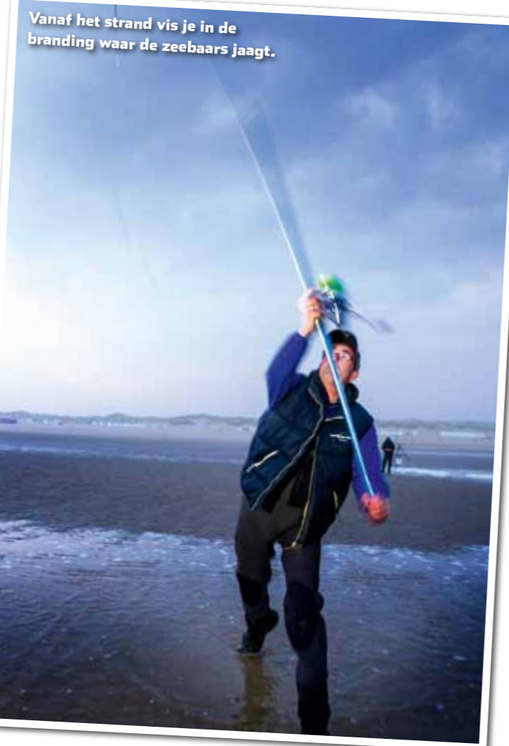
Vanaf het strand vis je in de branding waar de zeebaars jaagt.

Bij de dobbervisserij zal je veel meer rekening moeten houden met de weersomstandigheden dan wanneer je met lood op de bodem vist. Je vist immers vaak boven rotsachtige oevers die naar de kant toe schuin oplopen, zoals havenhoofden of de oevers van de Wester- en Oosterschelde. Ga je op zulke stekken aan de slag