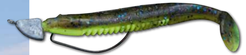
Weedless softbaits zijn hét kunstaas voor plantenrijk water.

Het 'traditionele' vissen met shads is hier vrijwel onmogelijk. Hetzelfde geldt voor de plugvisserij. Het continu omhoog takelen van waterplanten gaat immers heel erg snel vervelen. De enige manier om diep in het groen te kunnen vissen, is gebruik te maken van kleine spinnerbaits of om