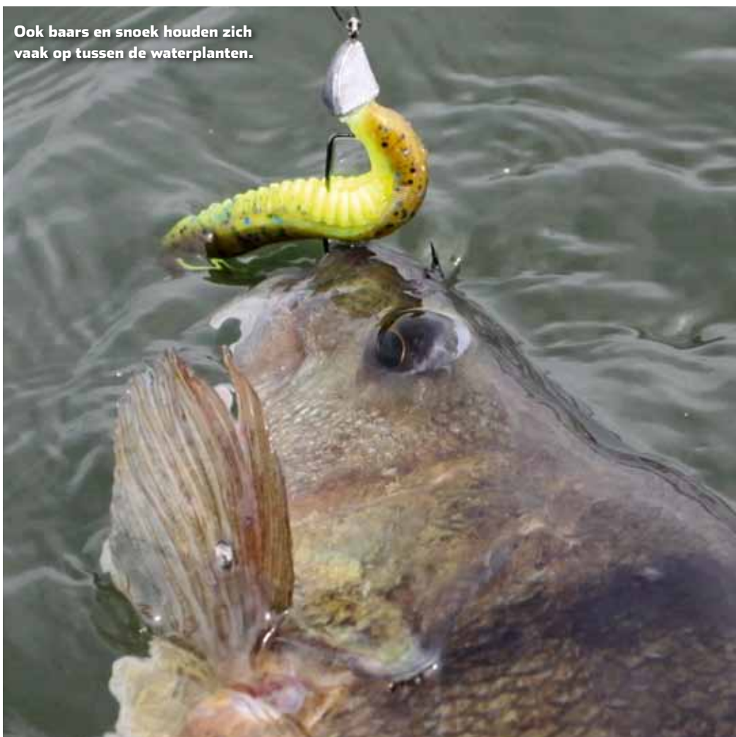
Ook baars en snoek houden zich vaak op tussen de waterplanten.

Zoals ik eerder al aangaf veranderen onze wateren ontegenzeggelijk in een rap tempo. Neem bijvoorbeeld het Volkerak. Tien jaar geleden stond daar slechts op bepaalde plekken wat groen, inmiddels zijn de waterplanten er wijdverbreid. Dit betekent dat we onze visserij zullen moeten aanpassen. Speel je hier op de juiste wijze op in, dan kun je zeker positief verrast worden. Al met al sta ik er soms echt van te kijken hoeveel vis er regelmatig heel diep in die bossen met waterplanten ligt. Dat weedless softbaits visserij Amerikaanse stijl is dus helemaal zo gek niet in onze Nederlandse wateren.