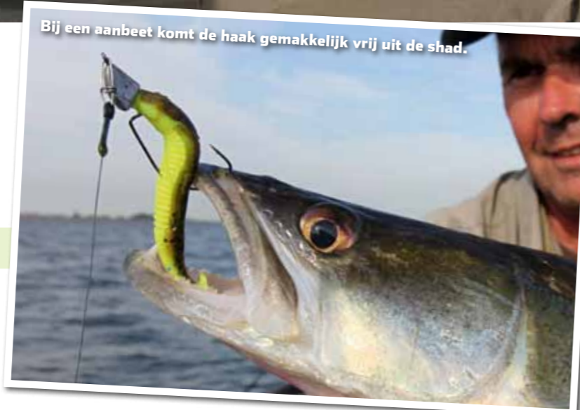
Bij een aanbeet komt de haak gemakkelijk vrij uit de shad.

te wordt toegepast is die met de verticaalhengel. Maar verticalen is zeker