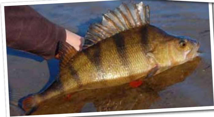
Bij hoge watertemperaturen is de vis extra kwetsbaar. Niet onnodig lang drillen en ook snel weer terugzetten is aldus het motto.

den en avonden dus. Momenten waarop de zon nog niet (of niet meer) vol op het water staat te branden. Het mooiste moment blijft in mijn ogen de vroege ochtend: heerlijk rustig in de ontwakende natuur, met als extra voordeel dat het water de hele nacht heeft kunnen afkoelen. Maar ook 's avonds laat en zelfs 's nachts vormen bij het hoogzomer roofvissen dé primetime momenten. De rovers worden dan actief!