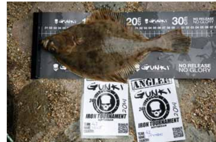
Gevangen vis diende op de meetplank met twee deelnemerskaarten te worden vastgelegd, en via een sms te worden aangemeld.

Voordat we echter aan de wedstrijd mogen beginnen, worden we – net als ieder ander team – eerst gekoppeld aan een 'partner team'. Het is vanuit veiligheidsoogpunt de bedoeling dat we gedurende de komende 24 uur permanent samen optrekken. De Nieuwe Maas, de slagader van het wedstrijdparcours, is nu eenmaal een gevaarlijk hard stromende slok water en daarnaast is Rotterdam een grote stad met alle bijbehorende nachtelijke taferelen. Bovendien is er voor de buitenlandse teams – zo ongeveer de helft van het deelnemersveld –