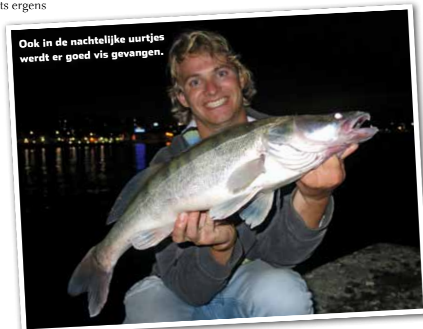
Ook in de nachtelijke uurtjes wordt er goed vis gevangen.