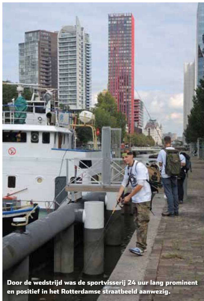
Door de wedstrijd was de sportvisserij 24 uur lang prominent en positief in het Rotterdamse straatbeeld aanwezig.

peuteren onder het kantje te vervuilen voor het diagonalen op enige afstand. De massaal richting de Spido vliegende lijnen en kunstaasjes leveren een hilarisch tafereel op.