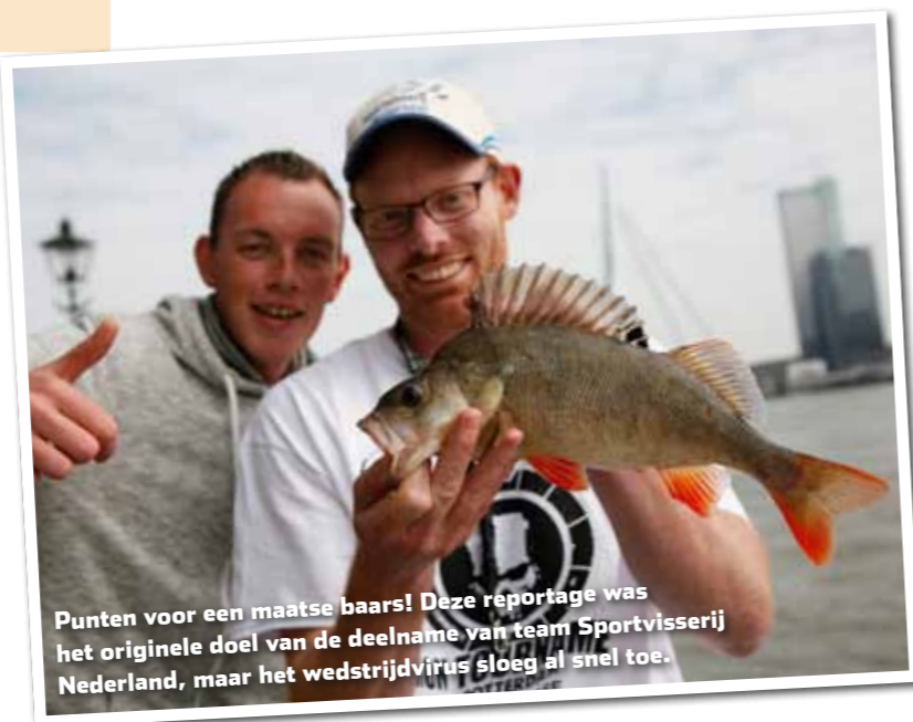
Punten voor een maatse baars! Deze reportage was het originele doel van de deelname van team Sportvisserij Nederland, maar het wedstrijdvirus sloeg al snel toe.

eigen ongeschreven wetten en (dress)codes. 'Image is everything', om maar eens een bekend gezegde uit de reclamewereld aan te halen. Vergelijk het met de mode: in mijn middelbareschooltijd moest je Nike Air Max sportschoenen hebben, anders