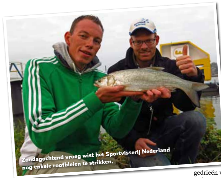
Zondagochtend vroeg wist het Sportvisserij Nederland nog enkele roofbleien te strikken.