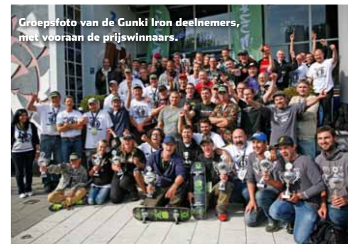
Groepsfoto van de Gunki Iron deelnemers, met vooraan de prijswinnaars.

honderd meter verder is ook vis actief en vangt Ties een mooie zilveren pijl van 54 cm aan de shad. Hoewel we er nog een eind-sprint uit persen, slagen we er naast een baars van 35 cm niet meer in om in het laatste uur van de wedstrijd nog een fatsoenlijke vis bij te schrijven. Zo blijven we drie maatse vissen verwijderd van de vijftien