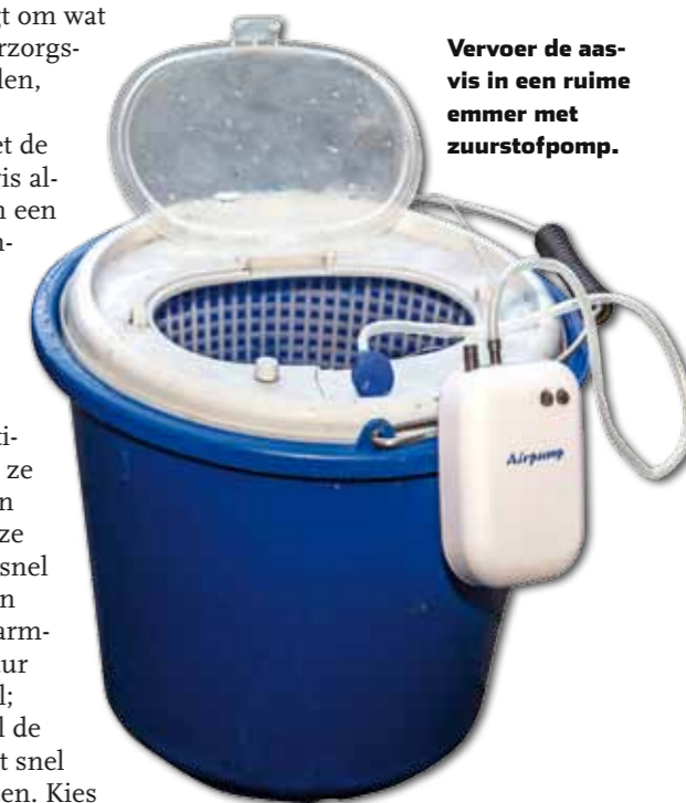
Vervoer de aasvis in een ruime emmer met zuurstofpomp.

Vul de bak in eerste instantie voor tweederde met water waar je de vis hebt gevangen. In het begin is de witvis namelijk vatbaar voor bacteriële infecties en schimmels. Je kunt dit goeddeels ondervangen door preventief zeezout (twee gram per liter water) opgelost in lauw water