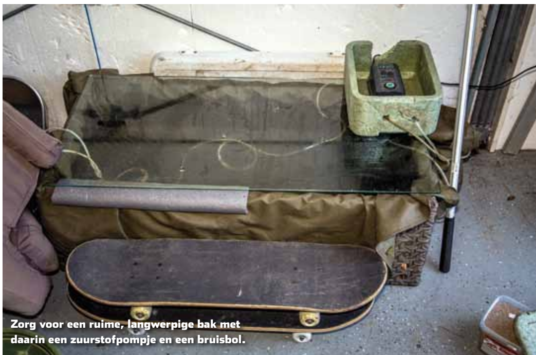
Zorg voor een ruime, langwerpige bak met daarin een zuurstofpompje en een bruisbol.

Door een paar dagen te voeren maak je meer kans om wat grotere voorns te vangen. Zeker met een blikmaïs-korrel op de haak vang je weliswaar minder, maar wel sneller de grotere vissen. Houd een maximummaat aan van tussen de 20 en 30 centimeter (met een max. van 10 exemplaren, zie kader wettelijke regels) en laat de grotere dames zwemmen. Dat zijn kuitmachines met de juiste genen die belangrijk zijn voor nieuwe jaarklassen. Behandel de vissen die je vangt voorzichtig. Maak je handen nat zodat de slijm laag die de vis beschermt tegen infecties intact blijft. Gebruik een hakensteker en een fijnmazig leefnet om je vangst aan de waterkant in te bewaren en vervoer de aasvis in een ruime emmer met zuurstofpomp.