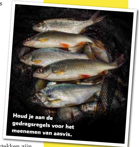
Houd je aan de gedragsregels voor het meenemen van aasvis.

temperatuur in je opslagbak koel te houden. Bovendien verzamelt de witvis zich rond deze tijd in havens of de zijvaarten van kanalen die door woonwijken lopen. Hier kun je nu mooie aantallen witvis vangen. Voer een aantal dagen met bijvoorbeeld blikmaïs, winterpellets, maden, gekookte rijst, macaroni, fijngeknepen aardappels – restjes avondeten – of gewoon kant-en-klaar witvisvoer. Puike stekken zijn bruggen, duikers, steigers, (woon)boten of overhangende takken.