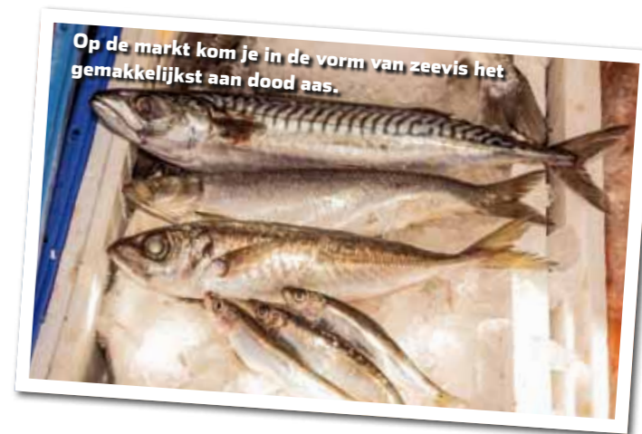
Op de markt kom je in de vorm van zeevis het gemakkelijkst aan dood aas.

De direct na de vangst gedode witjes verpak je per vier in een boterhamzakje. Haal ze de avond voordat je gaat vissen uit de vriezer en leg ze in een afgesloten bak op een koude plek, zo ontdooien ze het best. Neem een extra zakje als voorraad mee in een koelbox. Loopt het hard qua aanbeten, leg dit diepgevroren voorraadje dan alvast in het water. Dan kun je ze na een uur aan de dreg hangen. Schat van tevoren een beetje in hoeveel witvis je wilt invriezen, want een voorraad langer dan een half jaar bewaren is niet aan te raden. De aasvis wordt dan papperig bij ontdooien. En het is letterlijk doodzonde wanneer je na het snoekseizoen met aasvissen blijft zitten.