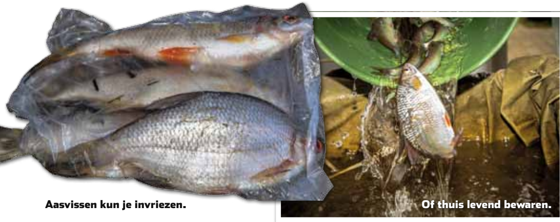
Aasvissen kun je invriezen.