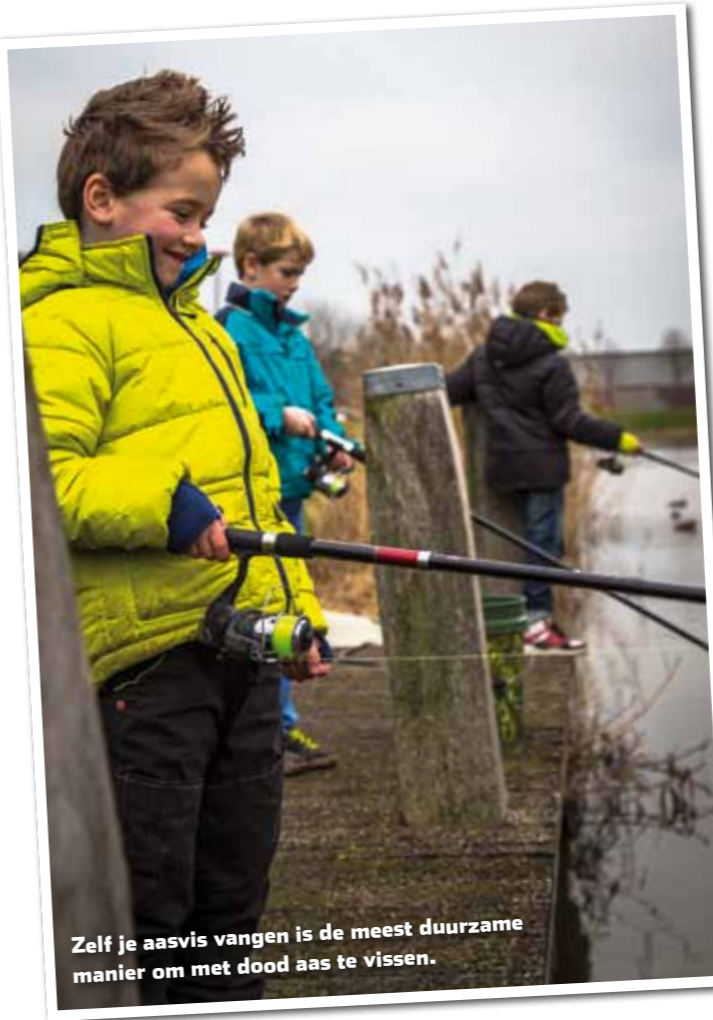
Zelf je aasvis vangen is de meest duurzame manier om met dood aas te vissen.

Een voorraadje witvis in je vriezer aanleggen is simpel.