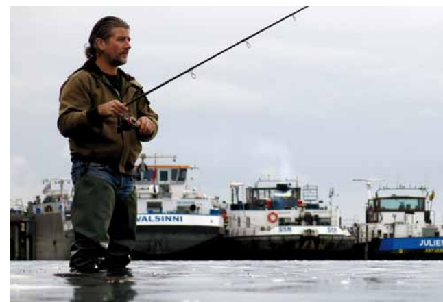
Met je zoete roofvisset kom je 's zomers aan zee ook een heel eind.