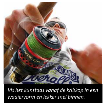
Vis het kunstaa's vanaf de kribkop in een waaivorm en lekker snel binnen.

blei vangen. De beste plek: kribkopen, en dan met name de stroomkolk direct stroomafwaarts van de kribkop. Pak kleine plugjes en vis deze dwars door de stroomkolk snel binnen. Na tien minuten nog geen aanbeet? Door naar de volgende krib!