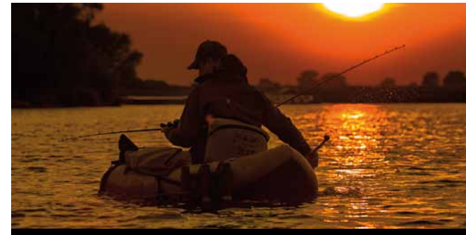
Met de bellyboat op meerval is een waanzinnige ervaring!

richten op de rivieren (en plassen) met een goed meervalbestand – denk aan de Maas en Maasplassen in Limburg, de Waal en de Westeinderplassen. Onthoud dat meerval met name in de avondschemering en het donker goed vangbaar is. Als aas kies je voor grote shads, een dikke tros dauwwormen of een dode aasvis aan een licht verzwaarde takel. Wil je een poging wagen met de bellyboat – de beleving is ongeëvenaard en een trailerhelling