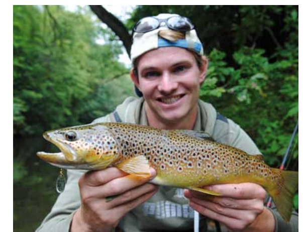
Met de Mepps Aglia no. 1 spinner tackle je alle Duitse beken.