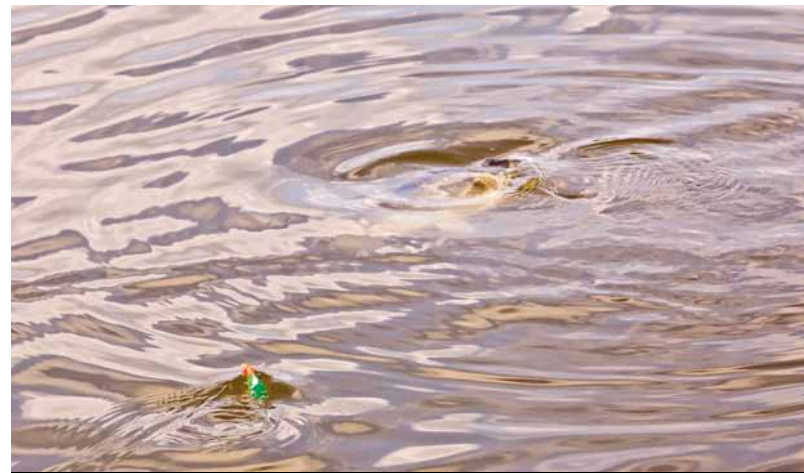
Drijvend op winde vissen is een leuk alternatief in de gesloten tijd voor kunstaas.

Ook als roofvisser wil je wel eens wat anders. En wat is er dan mooier dan een visteknik waarbij je gewoon je spinhengel kunt gebruiken? Daarmee kun je namelijk perfect op winde – stiekem ook een 'semi-roofvis' – vissen. Op een hele simpele maar doeltreffende manier: met de drijvende broodkorst. Monteer een karperhaakje maat 10 of 12 aan het eind van een stuk 22/00 nylon, schuif een elastiekje (baitband, verkrijgbaar op de karperafdeling) over de haak en klem hier een bescheiden broodkorstje in. Desgewenst monteer je voor meer werpgewicht nog een speciale 'float controller' en naar de rivier ermee. Installeer jezelf op een krib en voer eerst een