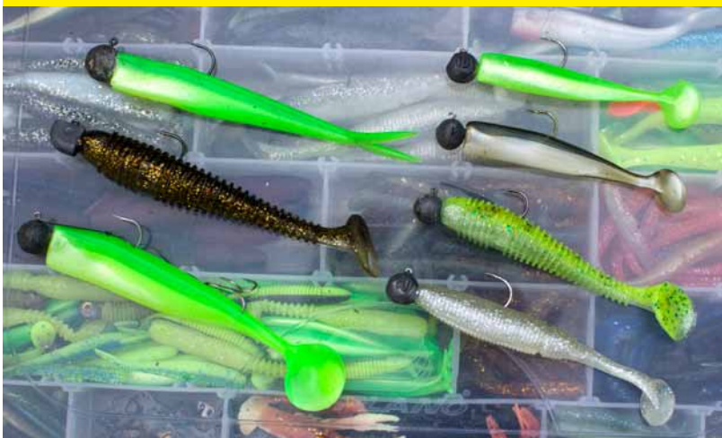
Een selectie van bewezen vangers.

Tenslotte heb je natuurlijk shads en jigkoppen nodig. Kies voor gewichten van zo'n 10 tot 25 gram die je combineert met shads van 8 tot 13 centimeter lengte. Voor wat betreft de kleuren hebben in het begin van het seizoen grote, felgroene shads mijn voorkeur. Later in het jaar zijn kleine bruine en zilveren shads bewezen vangers. Shads met kleine schoepstaartjes zijn top en doen het bijna altijd wel goed. Toch kan het ook lonen om eens een vstaart op een zware jigkop te prikken. Deze combi ploft lekker hard neer op de bodem en soms is dit de truc om aanbeten uit te lokken.