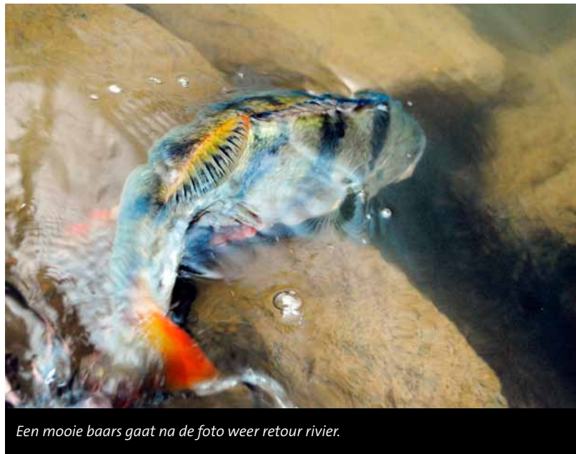
Een mooie baars gaat na de foto weer retour rivier.

Meestal is het na een paar kribben wel duidelijk of de vis in de stroomnaad of op het ondiepe ligt, zodat je de volgende kribvakken efficiënter kunt uitvissen. Een stuk of tien