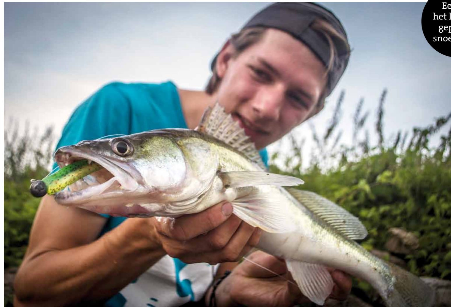
Een uit het kribvak geplukte snoekbaars

De IJssel begint bij Arnhem en stroomt bij Kampen het IJsselmeer in. Hoe verder stroomafwaarts je gaat, des te breder de rivier en hoe lager de stroomsnelheid wordt. Dit