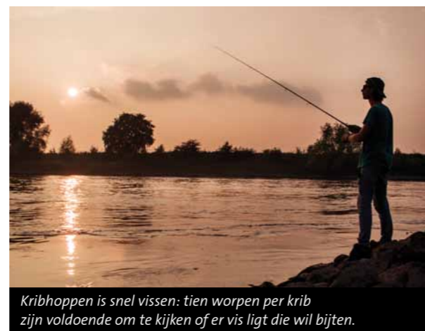
Kribhoppen is snel vissen: tien worpen per krib zijn voldoende om te kijken of er vis ligt die wil bijten.

>> MOLEN EN LIJN Op de hengel komt een 2500 formaat spinmolentje met een 10/00 gevlochten lijn. Die schuurt snel kapot op de scherpe stenen en mosselbanken die in de rivier liggen, dus bevestig ik altijd een voorslag aan de dyneema lijn. Hierbij kies ik voor een meter 35/00 fluorocarbon. Dat klinkt wellicht wat lomp, maar je verspeelt zo echt minder materiaal. Aangezien de kans op snoek in de IJssel aanzienlijk is, monteer ik voor de zekerheid soms ook een stalen onderlijn. Behalve snoek die regelmatig een shadje grijpt, zijn overigens ook bijvangsten als roofblei en meerval geen uitzondering meer!