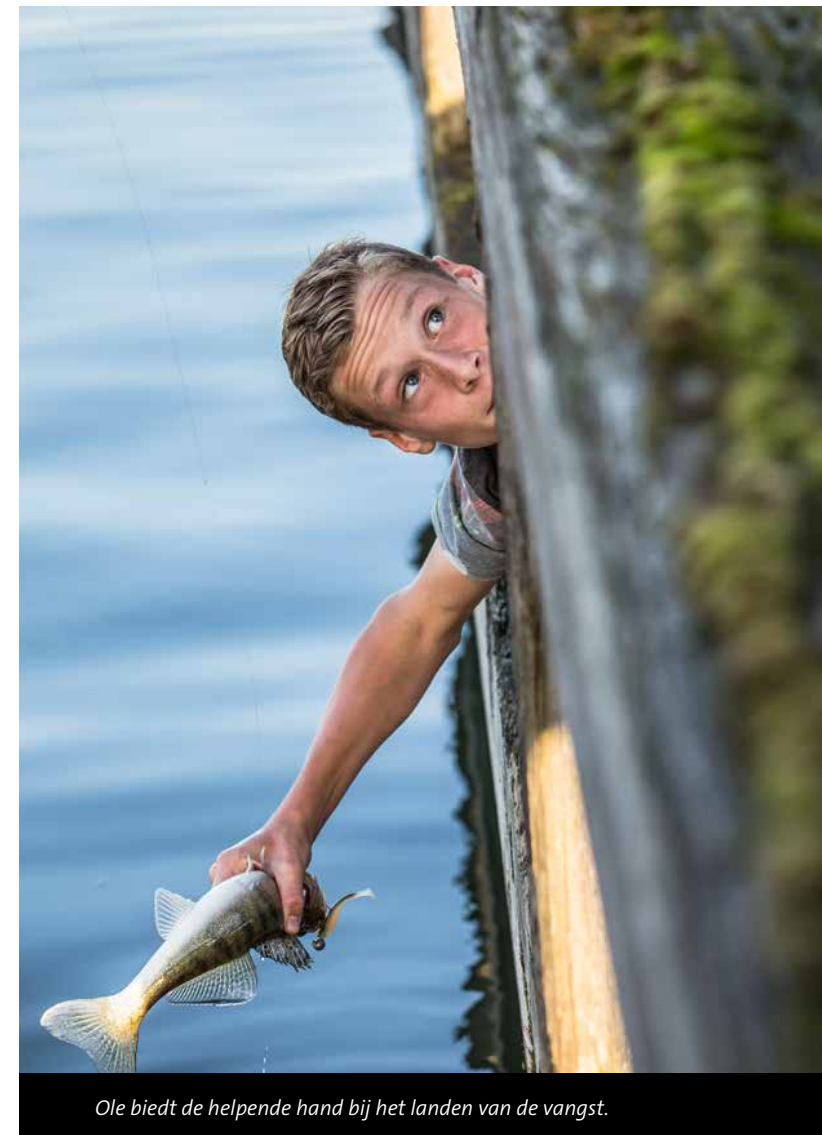
Ole biedt de helpende hand bij het landen van de vangst.