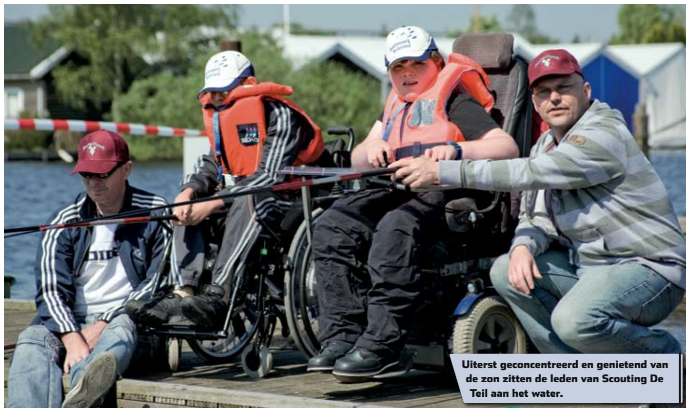
Uiterst geconcentreerd en genietend van de zon zitten de leden van Scouting De Teil aan het water.