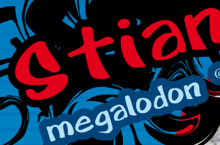
Stian voert eerst de eendjes, dan komen de brasems vanzelf.