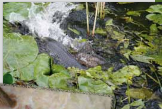
Bij de paai gaat het er soms wild aan toe.

Van de duizenden eitjes die bij de paai in het water terechtkomen, hechten de meeste zich daarna snel vast aan waterplanten. Uit het eitje komt na een paar dagen een vislarfje tevoorschijn, dat binnen een paar weken al op zijn vader en moeder gaat lijken. Nog veel later kunnen deze visjes zelf uitgroeien tot écht grote dames en heren. Al wordt lang niet ieder eitje een kanjeris.