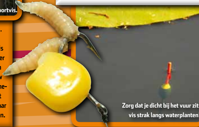
Zorg dat je dicht bij het vuur zit: vis strak langs waterplanten!

Als de zeelten uit hun schuilplaats komen en je voerplekje hebben gevonden, zie je dit vaak aan de hele kleine belletjes die op je stek verschijnen. Als het goed is, zal daarna je dobbber beginnen te bewegen. Een stukje naar links, een beetje naar rechts, ietwat omhoog en af en toe even omlaag. Dit is typisch voor zeelt. In tegenstelling tot wat karper en brasem vaak doen, zal een zeelt je aas bijna nooit in één keer opslurpen. Wacht daarom geduldig met aanslaan totdat de vis de dobbber echt onder water trekt – anders sla je meestal mis.