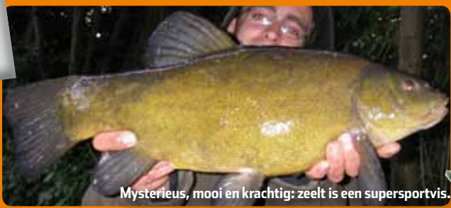
Mysterieus, mooi en krachtig: zeelt is een supersportvis.

Minischubjes, oranje kraallogjes en een mysterieus goudgroen lijf: zeelt is een schitterende vis om te zien. Daarbij zorgt zijn machtige staartvin voor flink wat power. Zo'n vis wil iedereen wel vangen. Maar waar en hoe doe je dat?