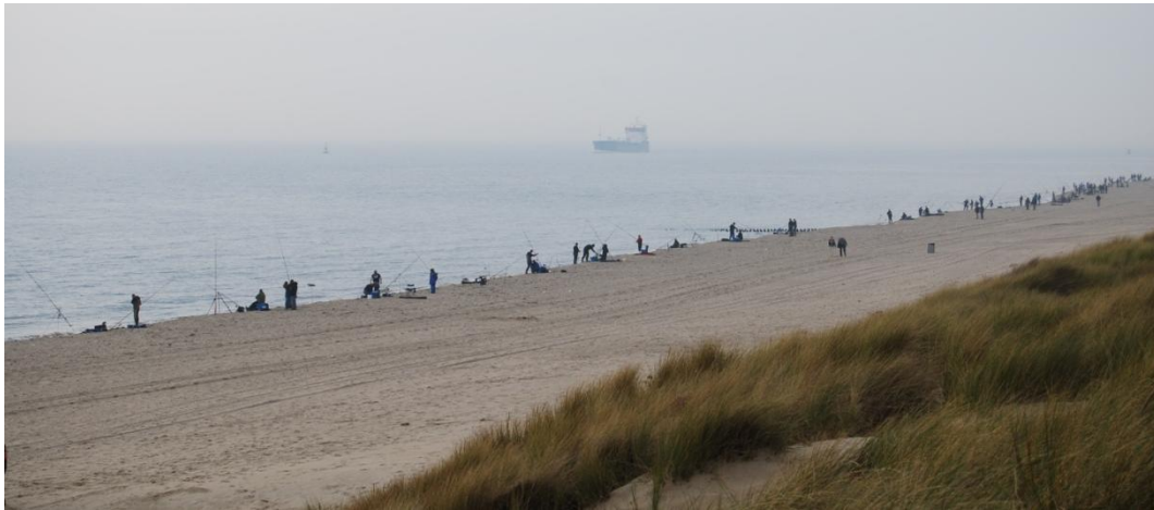
Overzicht strand bij "Westduin"