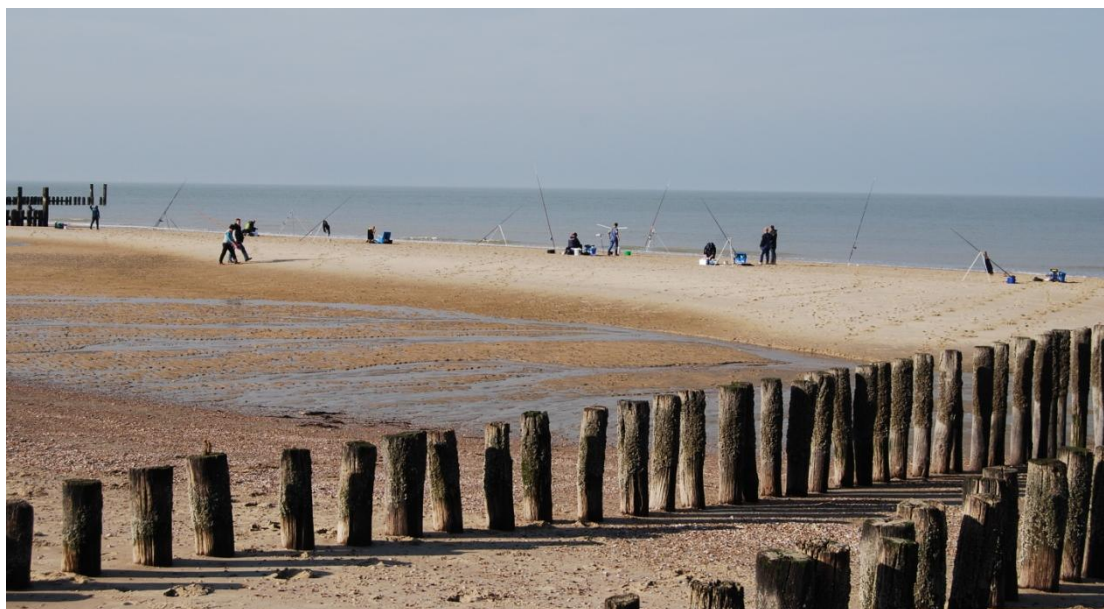
Strand bij de "Zeven Golven"